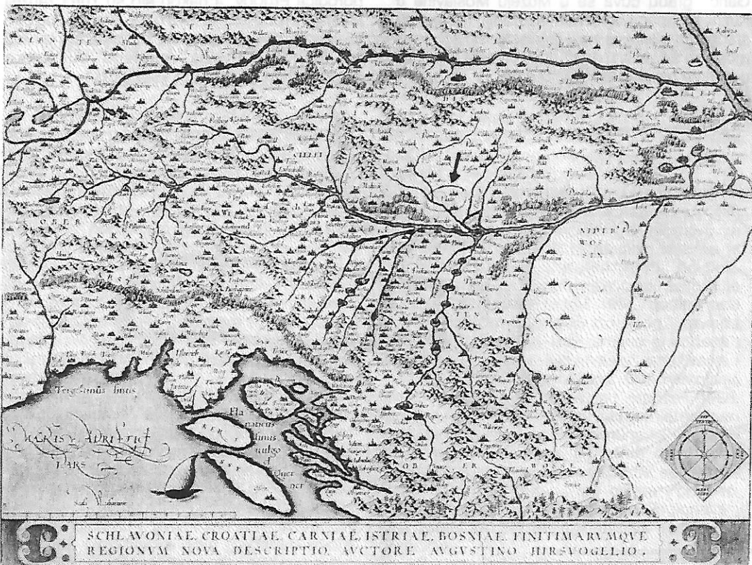
NA KARTI IZ 1595. GODINE PORED ČAZME I GARIĆA UCRTAN JE I PLOVDIN GRAD (PLODIN)

I na području općine Garešnica postoje ostaci jednoga burga koji je vrijedan znanstvenog interesa. To je BRŠLJANOVAC GRAD. Podignut je najvjerojatnije u drugoj polovici XIII stoljeća, a imao je zadatak da štiti sjeveroistočni dio bršljanovačke župe od prodora neprijatelja. Kad su Turci osvojili ove krajeve, preuzeli su ga i pored Moslavine i Zdenaca bio je jedna od značajnijih njihovih utvrda. Danas su ostaci toga grada još uvijek vidljivi, ali su u takvom stanju da bi rekonstrukciju bez detaljnijih istraživanja bilo teško izvesti.