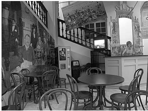
sl.8. Izložba "Secesija u Hrvatskoj": prostorni kolaž kavana s automatom za kavu

Kroz povećanu fasadu Kina Urania dolazi se u minikino s projekcijama filmova koji označavaju početke kinematografije u Hrvatskoj.