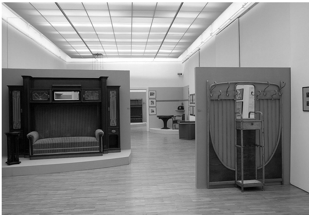
sl 3. Izložba "Secesija u Hrvatskoj": interijer kuće; svaki dio stana predstavljen je na zasebnom podestu s paravanom u drugoj boji

čudotvorni napitak liječio od svih bolesti; Elsa-fluid bio je i uspješan hrvatski proizvod koji se prodavao diljem svijeta, a njegov izumitelj Eugen Viktor Feller izgradio je četiri zgrade koje su znatan doprinos razvoju hrvatske arhitekture.