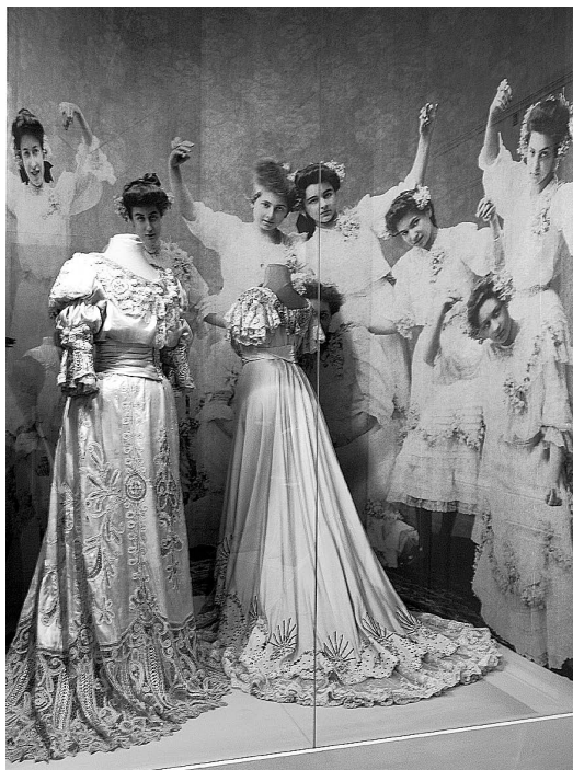
sl.9. Izložba Secesija u Hrvatskoj: kult prirode