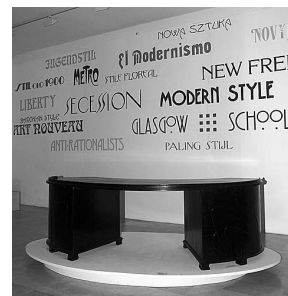
sl.4. Izložba "Secesija u Hrvatskoj": na zidu su ispisane varijante naziva secesija

Da bi izložba bila potpuna, "napravili" smo i kavanu koja je kolaž Prve ličke kavane iz Gospića, sisačkog Velikog Kaptola i zagrebačkog Corsa , sa suvremenim automatom za kavu.