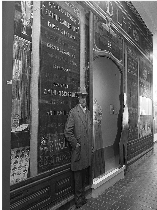
sl.7. Izložba "Secesija u Hrvatskoj": u malom dvorištu između depoa Muzeja smješteno je fotografski povećano dvorište bravarske radionice Devide - Modec