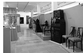
sl.5. Izložba "Secesija u Hrvatskoj": prezentacija morfologije stila - asimetrija