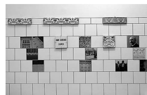
sl.12 Izložba Secesija u Hrvatskoj: keramičke pločice ugrađene u nacrtani raster na zidu