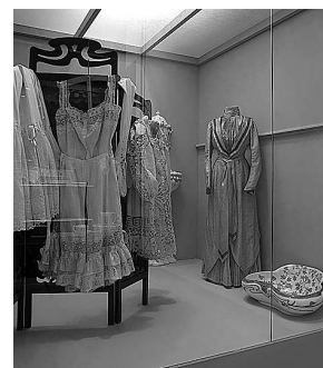
sl.11. Izložba Secesija u Hrvatskoj : "ženska" kupaonica

In the same way that the exhibition began with an overview of the situation before Art Nouveau, it ends with indications of periods that would follow. The black wall that stands as an indication of the outbreak of World War One and the end of Art Nouveau holds transitional works. The exhibition Art Nouveau in Croatia in the Museum of Arts and Crafts in Zagreb was open five months and was seen by 90,082 visitors.