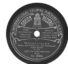
sl.4. Najlepnije ploče s početka prvih desetljeća 20. st..