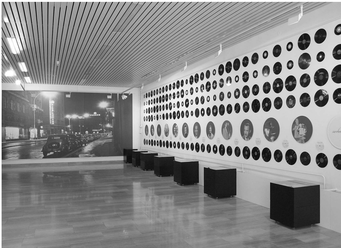
sl.8. Gramofonske ploče i izvođači, "Čarobna igla", MGR, 2004. Fototeka Muzeja grada Rijeke

samo rijetki a koje, usto, još nisu dobile patinu i postale pravi antikviteti.