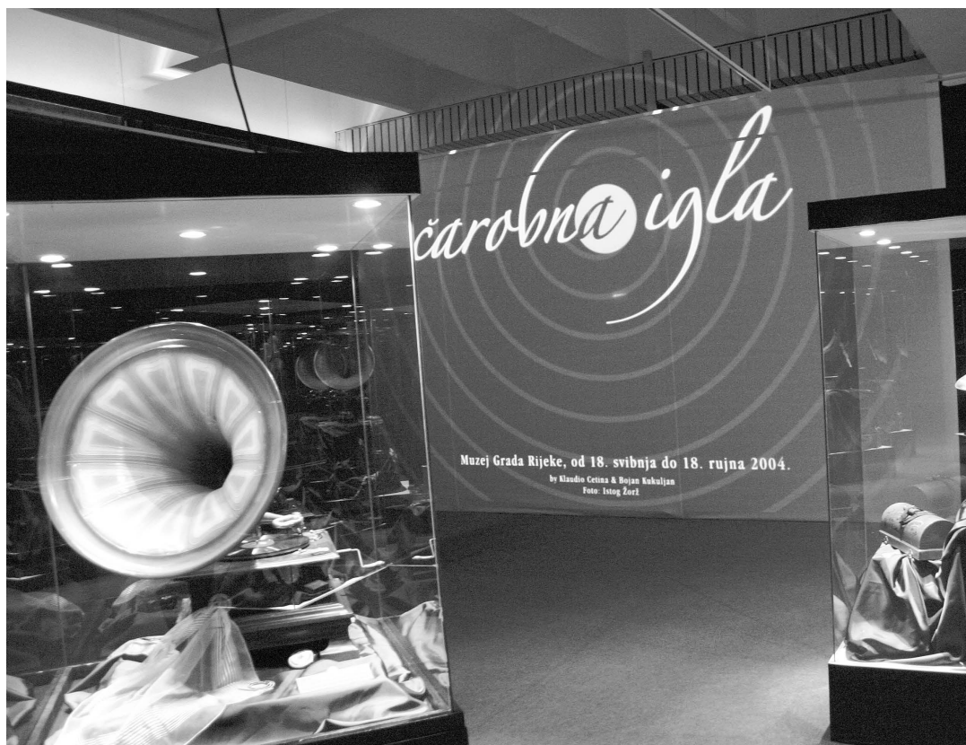
sl.1. Izložba zbirke gramofona i riječke diskografije "Čarobna igla" u Muzeju grada Rijeke, 2004.

ERVIN DUBROVIĆ □ Muzej grada Rijeke, Rijeka