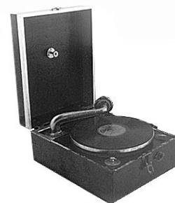
sl.9. Električni gramofon 1930.-1935.