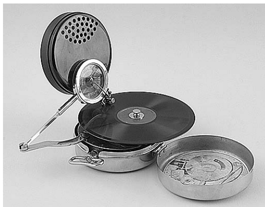
sl.5. Džepni gramofon Mickiphone, 1930.-1940., težina 1,6 kg, 2004.