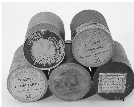
sl.7. Kutije voštanih valjaka za fonograf, primjerci u MGR nisu upotrebljeni, tj. u njih nije urezan zvuk