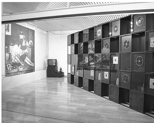
sl.2. Kako se kroz povijest mijenjao gramofon moglo se vidjeti na izložbi "Čarobna igla", MGR, 2004.

Otpočetka smo težili kulturno-povijesnom konceptu koji bi prikazivao društvenu povijest fonografije, običaje jednoga vremena vezane za pojavu "strojeva koji govore" (često su ih zvali the talking machines ili, u Rijeci, macchine parlanti ). Zanimao nas je i glazbeni ukus vremena i pojave o kojima se danas vrlo malo zna jer su se uglavnom zbivale od kraja 19. do sredine 20. stoljeća, pa je od toga doba minulo već više od pedeset godina. Namjerno smo propustili u izložbu uključiti