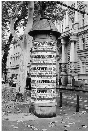
sl.4.-6. Promidžbeni materijal SDP-a koji je u izbore 2003. g. krenuo sa sloganom Da! Za budućnost Da! Za SDP. Jumbo plakatima i plakatima na informativnim stupovima pozivaju se birači da na predizbornoj skupini SDP-a poslušaju pjevačicu Severinu Vučković. Dokumentarna zbirka II. (20.st), Hrvatski povijesni muzej, Zagreb