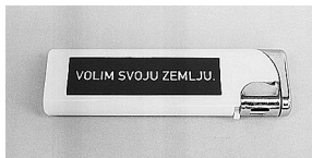
sl.10. -12. Stranački promidžbeni materijal za izbore 2003.: bombon (HDZ), jabuka s etiketom na kojoj piše "Zaljubljen u Hrvatsku" (HIP), upaljač s tekstom "Volim svoju zemlju".

Dokumentarna zbirka II. (20.st.), Hrvatski povijesni muzej, Zagreb