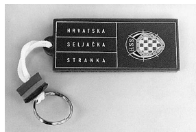
sl.13.-15. Stranački promidžbeni materijal za izbore 2003.: privjesci.

Dokumentarna zbirka II. (20.st.), Hrvatski povijesni muzej, Zagreb