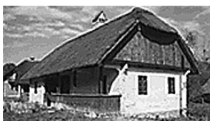
sl.1. Muzej "Staro selo" Kumrovec (muzej je u sastavu Muzeja Hrvatskog Zagorja)