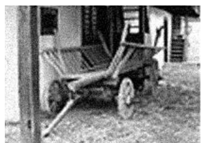
sl.3. Sastavni dio svake okućnice bile su gospodarske zgrade - staje, u tradicijskom graditeljstvu ovog kraja građene u maniri katnice.