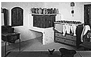
sl.2. Najvažniji kriterij prilikom revitalizacije bila je autentičnost objekata i njihova etnografska, povijesna i graditeljska vrijednost. Objekti u kojima domaćini nisu željeli živjeti pod određenim muzeološkim uvjetima, otkupljeni su od vlasnika, dok je nekoliko gospodarskih zgrada s okućnicama ostalo u izvornoj funkciji, odnosno koriste ih vlasnici.