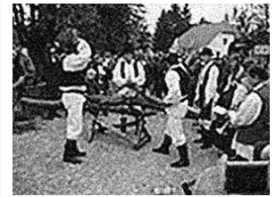
sl.4. Tradicionalna manifestacija „Zagorska svadba“, Muzej "Staro selo" Kumrovec