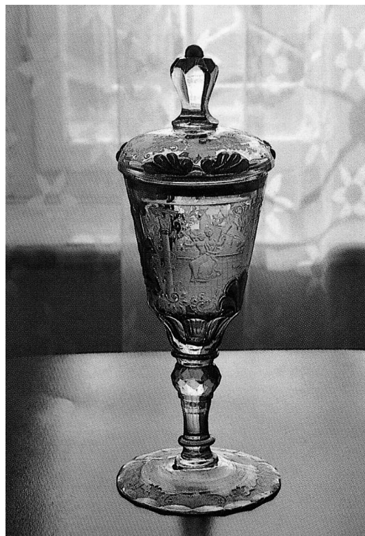
sl.2 Muzej stakla, Kamenický Šenov

ICOM-ovu godišnjem okupljanju Odbora za staklo (International Committee for Museums and Collections of Glass) uz potporu Češkoga nacionalnoga komiteta ICOM-a i uz pomoć praških Muzeja primijenjene umjetnosti ( Umeleckoprumyslove muzeum, Praha ) i Narodnog muzeja ( Narodni muzeum, Praha ) za temu češkog stakla ponuđen je najpoželjniji mogući okvir. U raznorodnosti podjela po kojima se ICOM-ovi komiteti dijele, čini se da odbori organizirani po vrsti materijala dobivaju posebnu kvalitetu različitim odabirom mjesta održavanja godišnjih sastanaka. Naime, tu su teme sastavnim dijelom okoline u obliku zbirke i postava sredine koja je domaćin skupu. Zbirke i muzeji postaju aktivnim sudionikom i zornim svjedokom svemu onome izrečenom u istupima pojedinih sudionika, a nisu tretirani kao puka pasivna kulisa za ugodniji boravak članova skupa. Naravno, bogatstvo ponude vezano uz temu sudionicima ostavlja malo prilike za posjet drugim muzejima i znamenitostima, ali barem kad je Češka u pitanju mnogi su si obećali doći ponovno i posjetiti i ostalo . Ono malo drugoga što sam dijelom uspjela iščitati hodajući Pragom bila je povijest arhitekture (kubistička arhitektura Josefa Chocholae), a malo skretanje s rute koju su u carstvu stakla organizirali češki