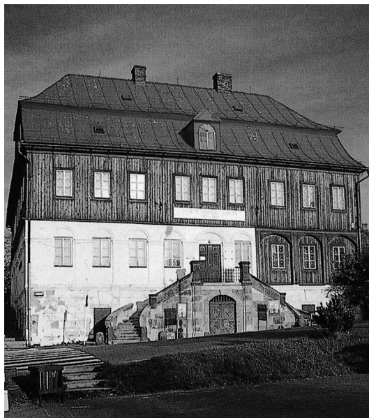
sl.1 Muzej stakla, Kamenický Šenov