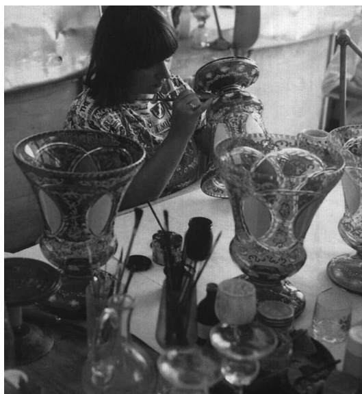
sl.5-7 Nový Bor, sjedište je direkcije Crystallexa kao i staklarskih radionica u kojima se izrađuje i ukrašava staklo.

u drugom katu dvorca, autora kustosa Ivana Krena, i to studijskoga modernog i suvremenog stakla, poput meni omiljenih primjeraka moderne klasike Ladislava Sutnara iz 1930-ih i primjeraka geometrizma u staklu 80-ih godina XX. stoljeća u izlošcima Pavla Trnke, Jaroslava Svobode i Vaclava Ciglera. Slijedio je posjet ranijem naselju staklara Jizerka u Jizerskim planinama i obilazak prostora kristalnog i obojenog, brojnošću najzastupljenijeg malahitnog stakla, tvornice Ornela i prostora zbirki staklenih perli i onih Desna , nazvanih po istoimenom području, u kojemu proizvodnja stakla započinje krajem XVIII. stoljeća i gdje se kasnije, u XX. stoljeću, spominju imena vlasnika najistaknutijih tvornica u proizvodnji umjetničkoga kristalnog stakla - Heinricha Hoffmanna i Curta Schlevogta.