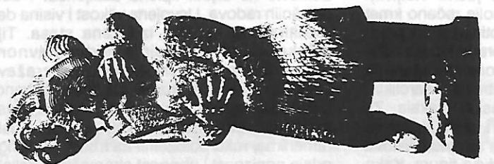
BRANKO MEDIMOREC Plesački par