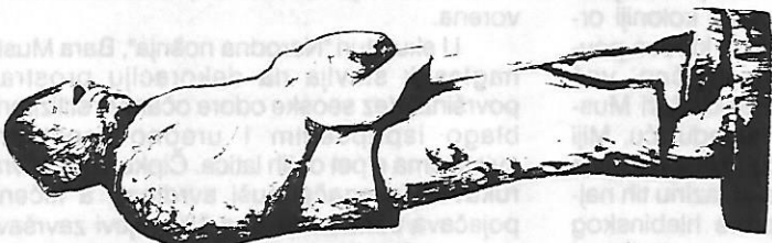
DRAGICA BELKOVIĆ Težak na poldan