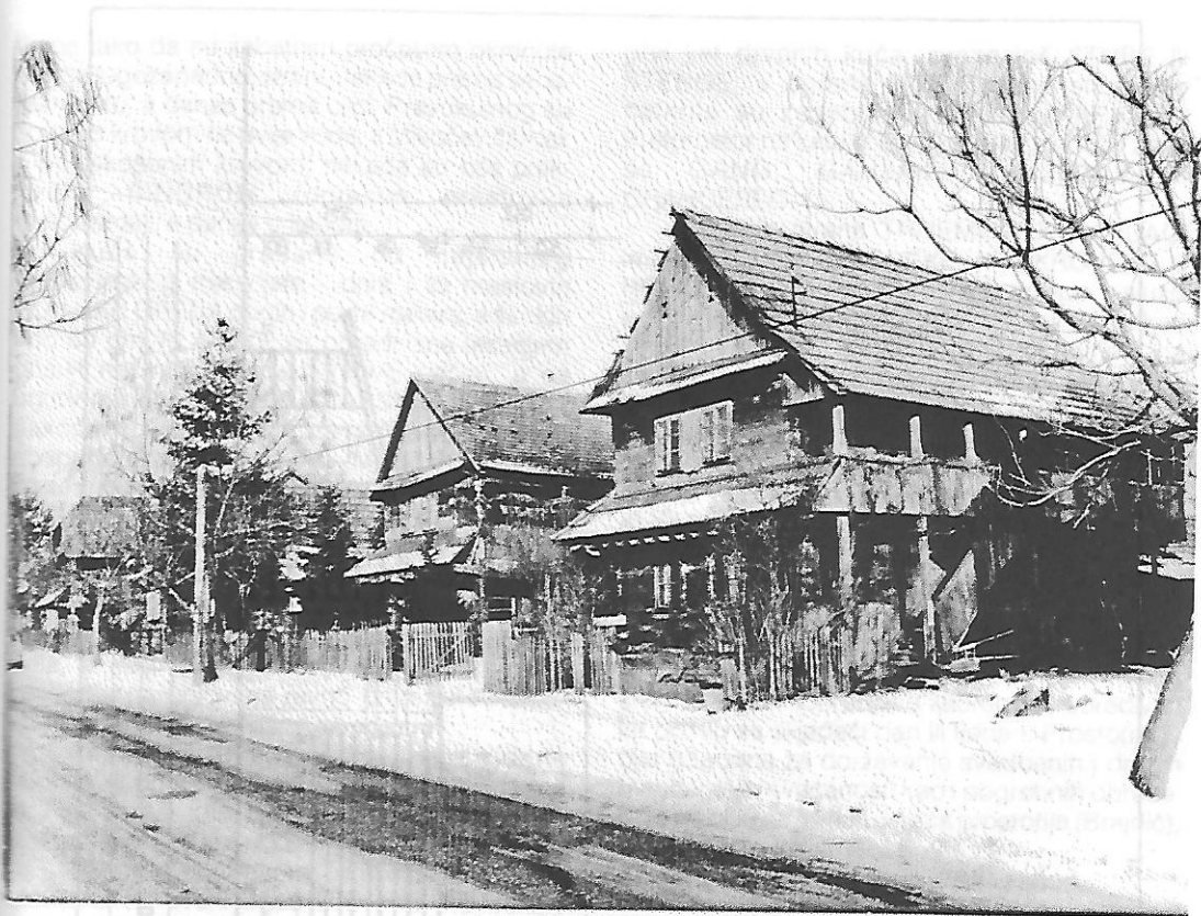
Ruralna cjelina u Crkvenoj ulici u Kutini

raščlambi unutarnjeg prostora te drugim značajkama karakterističnim za narodno graditeljstvo ovoga kraja.