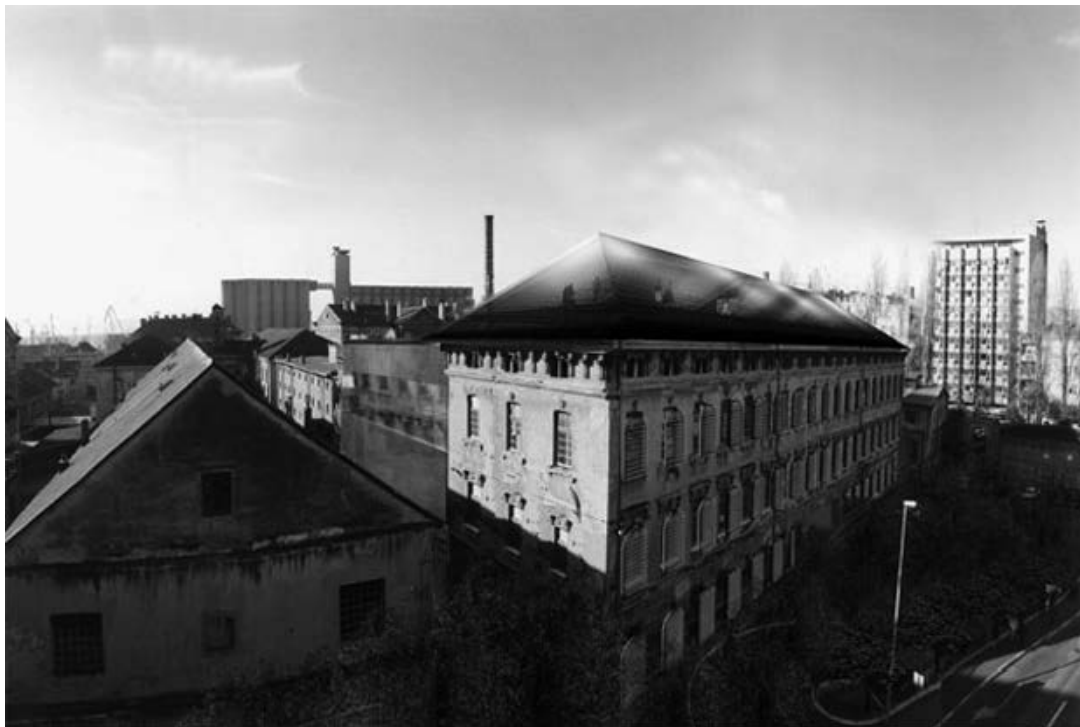
sl.2 Arhitektonsko natječajno rješenje za novi muzej MMSU/Moderne i suvremene umjetnosti, Rijeka, 2002.

pak Libeskindova Berlina, u kojima je sama zgrada središnja tema muzeja.