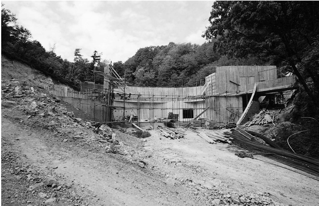
sl.3 Izgled gradilišta budućeg muzeja 15. svibnja 2003. godine