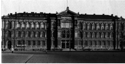
sl.9 Ateneum, finska škola za umjetnički obrt, sagrađena je 1887.godine kada se počinje graditi i zagrebačka Obrtna škola i Muzej za umjetnost i obrt.