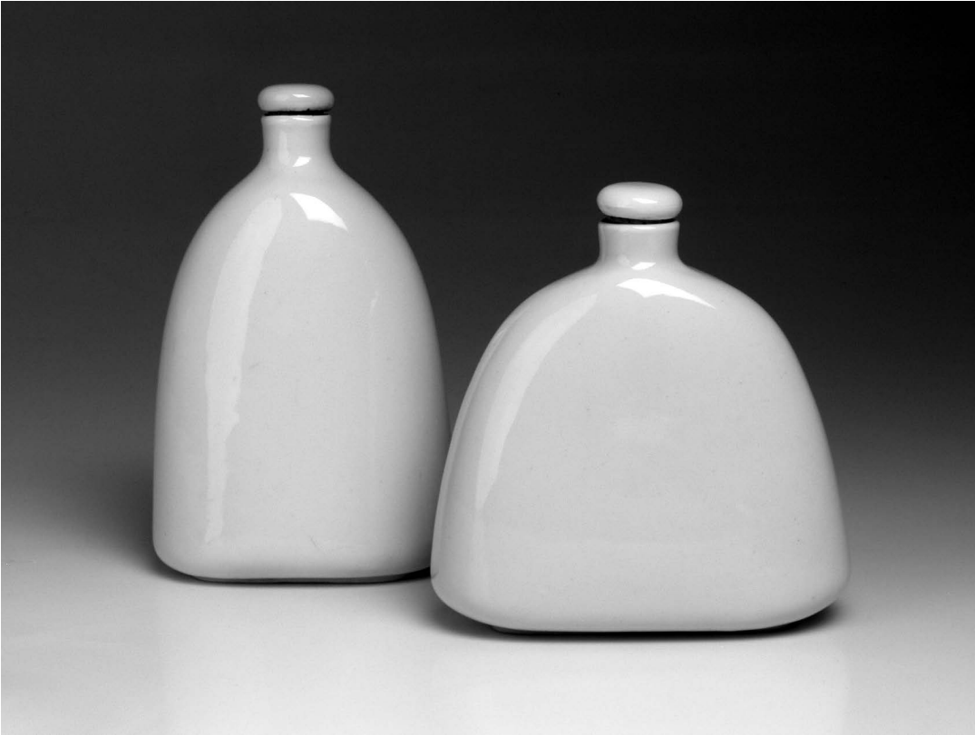
sl.8 Stella Skopal: Boce za žestoka pića; u stalnom postavu MUO

planu, intenzivno se radilo i na marketingu finskog dizajna u domovini.