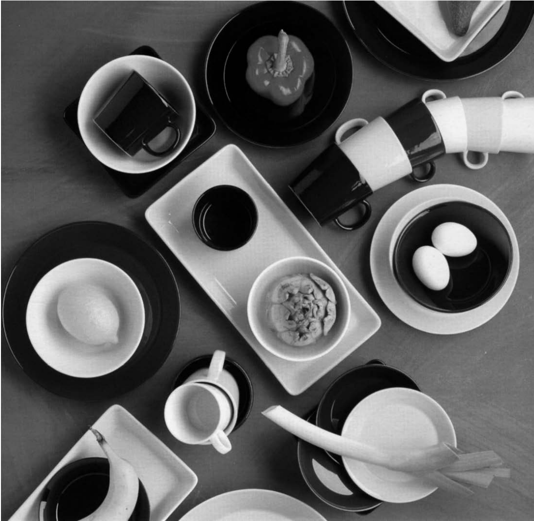
sl.12 Kaj Franck: "Teema"

Prototipovi nastaju ili automatski iz proizvodnje ili po stranim katalogima, revijama, uzorima i licencama, ili čak neovlaštenim prisvajanjem stranih modela. Problemi nisu teoretski definirani, kriteriji nisu formulirani, a niti se praktičkim mjerama stvaraju uvjeti za njihovo rješavanje. Negativne posljedice očituju se u likovnom balastu, kojim se opterećuje potrošač, u opremi i artiklima, čija je uporabljivost problematična, a estetska vrijednost nedovoljna, - i u supremaciji inozemne robe nad velikim dijelom domaće, na našem i vanjskom tržištu.