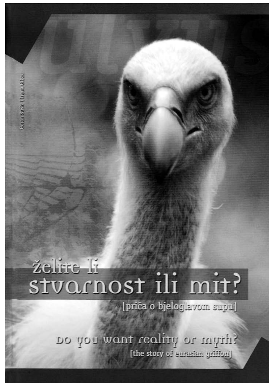
sl.1 Naslovnica kataloga izložbe "Želite li stvarnost ili mit?" priča o bjeloglavom supu nakladnik: Hrvatski prirodoslovni muzej, Zagreb, lipanj 2002.

IRENA GRBAC □ Hrvatski prirodoslovni muzej, Zagreb