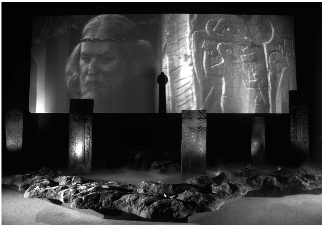
sl.3 Rekonstrukcija keltske kuće, Manannanova kuća, Peel, dobitnik nagrade Britanski muzej godine

UKLJUČIVANJE ZAJEDNICE. S obzirom na sve to, osobito je važno da i sva druga područja djelatnosti uključena u planiranje turističkog proizvoda shvate cilj strategije, način njezine primjene te kako se zadani cilj može postići. Jednako toliko je važno da svi sudionici te strategije znaju kako će im koristiti sam plan i njihova sposobnost vlastite interpretacije zadane teme.