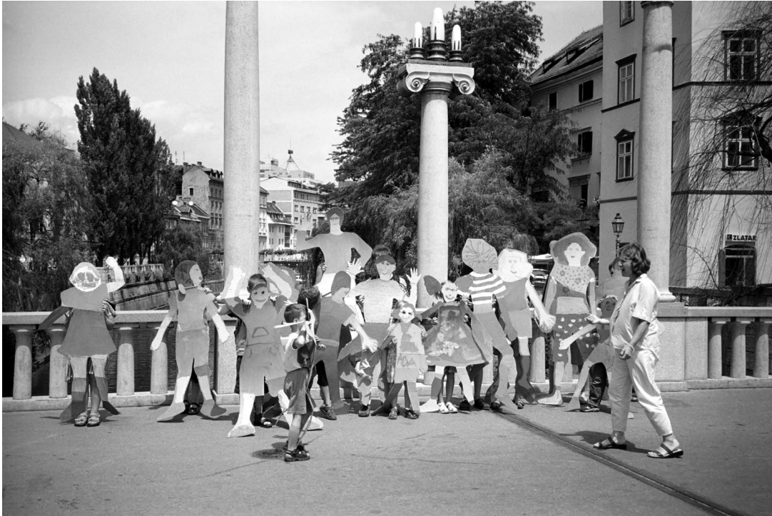
sl.7 U razdoblju kada je Turjaška palača bila zatvorena preseljen je rad s posjetiteljima na gradske ulice i druge lokacije.

Proces revizije u kojem sudjeluje deset kustosa omogućio nam je evaluaciju naših zbirki i formiranje nove skupljačke politike koja se u srednjoročnom razdoblju 2000.-2004. godine usredotočuje prije svega na dopunjavanje postojećih zbirki i nabavu predmeta koji su nam potrebni za stalni postav s radnim naslovom Povijest Ljubljane i njezinih ljudi . Samo uvođenje toga sustava rada omogućava nam da se predmeti odmah stručno obrađuju, bolje planiraju aktivnog nabavljanja muzejske građe, te raspoređivanje vremena i radne energije pri pojedinačnim projektima.