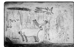
sl.4 Evin bakropis