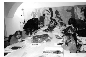
sl.2 Klinci s Ribnjaka, svi vrijedno crtaju...