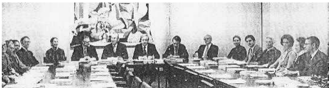
sl.1 Fotografija muzejskog odbora Muzeja moderne umjetnosti u New Yorku (MOMA) objavljena je u knjizi Museums in Crisis , 1972.