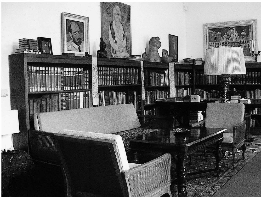
sl.6 Krležin Gvozd, Krležina radna soba (dio)

plohama shematski su crteži arhitekture (na pravokutnoj ploči gotovo uvijek veliki buket žutih ruža). Okružuje ga pseudo-klasicistička sofa s dva visoka naslonjača (oko 1930. godine?) te bidermajerski naslonjač s novom prugastom presvlakom. Unatrag, kod bijelog kamina, druga je zona okupljanja, s naslonjačem od pozlaćenog rezbarenog drva, kopijom klasicizma s presvlakom od prugastog brokata. Po potrebi, u slučaju većeg broja uzvanika, njemu se pridodavao nasuprotni identičan naslonjač koji stoji pred bidermajerskim sekreterom. Na podu, ispod obiju kompleta, prostiru se orijentalni tepisi. Povrh kamina veliko je ovalno pozlaćeno zrcalo (u osovinama reljefno izvedene giralnde). Na kaminu uočljiva brončana medaljica: Orfej s lirrom , rad pariškog medaljera L. Coudraya iz 1900. godine, a do kamina Augustinčićevi Mladić i djevojka s gitarom , sadreni rad iz 1928. godine koje povezuje Belina muzikalnost i potreba za nekim glazbenim ugodajem.