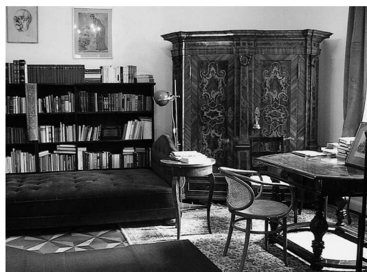
sl.3 Krležin Gvozd, Krežina spavaća soba Fototeka: Muzej grada Zagreba; foto: Miljenko Gregl, 2001.