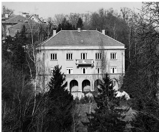
sl.1 Krležin Gvozd 23

SLAVKO ŠTERK □ Muzej grada Zagreba, Zagreb