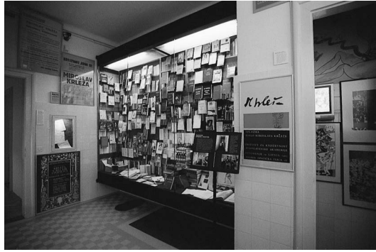
sl.8 Krležin Gvozd, (nekada kupaona) - na osvijetljenom duratransu prikazana je Povijest vile Rein i Krležine adrese stanovanja i školovanja

Fototeka: Muzej grada Zagreba; foto: Miljenko Gregl, 2001.