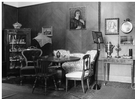
sl.2 Krležin Gvozd, Blagavaona