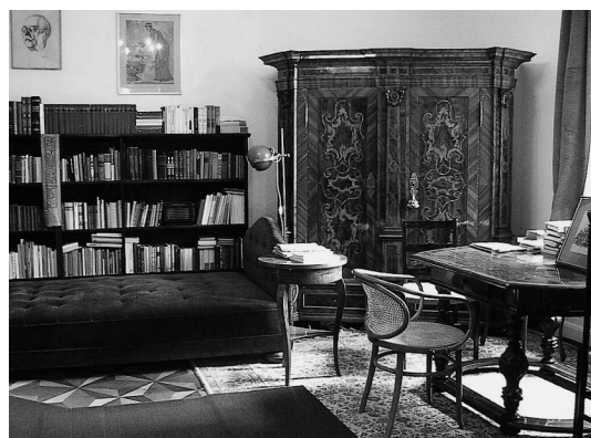
sl.5 Krležin Gvozd, Belina spavaća soba