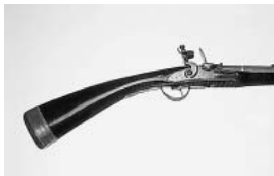
sl.3 Puška tipa čibuklije s mehanizmom na kremen i neukrašenim kundakom, sredina 18. stoljeća