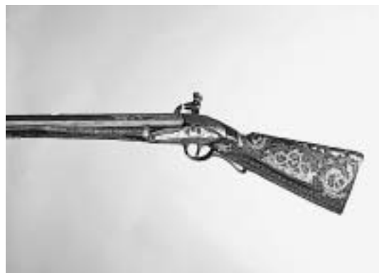
sl.10 Stražnja strana kundaka kratke lovačke puške s aplikama broda i zmaja, kat. br. 147.