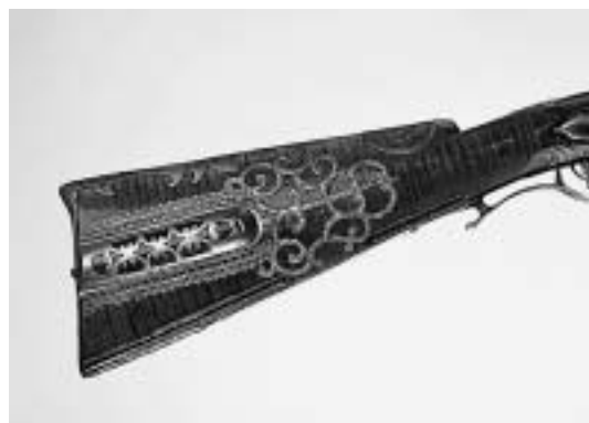
sl.11 Prednja strana kundaka kratke lovačke puške s lučno oblikovanim poklopcima spremnika s mjedanim aplikama koje podsećaju na ukras mihraba, kat. br. 148.

23 Ovalno udubljenje u zidu džamije od strane kible, gdje džamijski imam klanja rukovodeći grupnim klanjanjem. Kibla, strana svijeta, na kojoj se nalazi Ćaba u Meki. Škaljić, 1989., 463, 407.