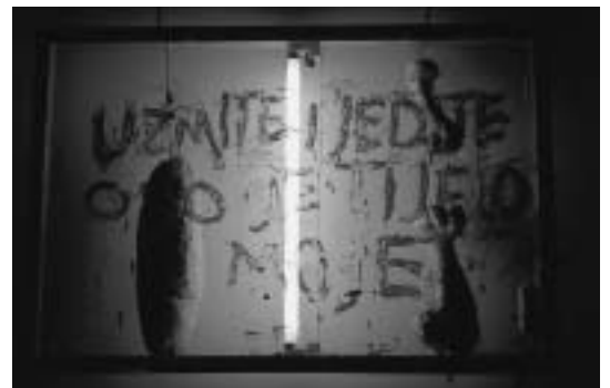
sl.5 Sven Stilinović Uzмите i jedite ovo je tijelo moje / Take and eat; this is my body, 1998. kombinirana tehnika (metalni okvir, staklo, kruh, kosti, krv) / mixed media (metal, glass, bread, bones, blood) Galerija proširenih medija, PM, Zagreb