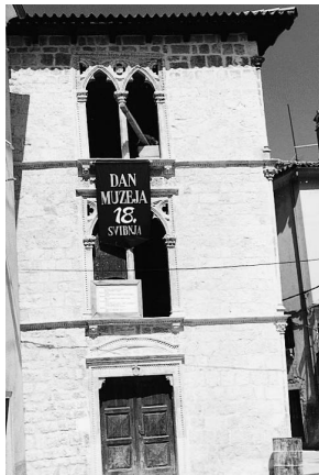
sl.1 Cres, palača Arsen