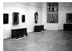
sl.1 Detalj s izložbe

Pod geslom Što ostavljamo? Spasimo kulturnu baštinu! pozvali smo donatore da prema vlastitom odabiru i mogućnostima pomognu u spašavanju izložbenih eksponata. Akcija će trajati do iduće godine, kada bi Muzej u isto vrijeme, u povodu Dana muzeja priredio izložbu restauriranih muzejskih predmeta, uključujući i muzejske pred-