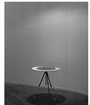
sl.1 Proširene granice, 1998.-2002., stalak, zrcalo, tiskana slova, žica 100W, 65x62 cm