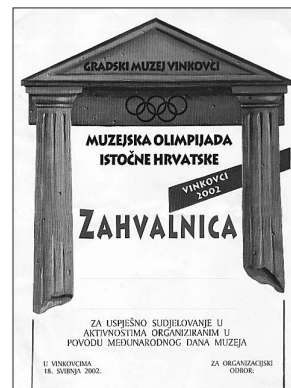
sl.2 Muzejska olimpijada, Zahvalnica za uspješno sudjelovanje

U povodu Dana muzeja u našem je Muzeju održana izložba akademskog slikara Vatroslava Kuliša Metamorfoze mora . Izložba je ostvarena u suradnji tri susjedna muzeja: Zavičajni muzej Slatina, Gradski muzej Virovitica, Zavičajni muzej Našice i Miroslava Gašparovića iz MUO-a. Na taj način dali smo svoj doprinos akciji globalizacije u muzejima. Naime, izložba se selila od jednog muzeja do drugog s tim da smo svi zajedno dijelili trošak izdavanja kataloga i pozivnica. Suradnjom triju muzeja ostvarene su o istom trošku tri izložbe eminentnoga hrvatskog umjetnika kojeg je tako upoznao širi krug posjetitelja. Ovu lijepu i uspješnu suradnju namjeravamo nastaviti i dalje te ovom dijelu hrvatske javnosti približiti hrvatsku umjetnost što bi jednom malom muzeju, kakav je naš, bilo vrlo teško ostvariti samostalno. Projekt smo ostvarili u želji da u tri naše muzejske ustanove imamo što kvalitetnije izložbene programe. Na taj način pokušavamo približiti hrvatsku metropolu našim sredinama u kojima postoje zainteresirani posjetioci i adekvatni prostori, koji po opremljenosti i veličini udovoljavaju izložbama renomiranih hrvatskih umjetnika. U programu otvorenja izložbe nastupile su učenice Glazbene škole Jan Vlašimsky i izvele nekoliko prigodnih skladbi na temu mora.