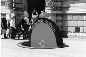
sl.1 Instalacija ispred zgrade Muzeja za umjetnost i obrt, snimio: Marijan Kumpar

VESNA LOVRIĆ PLANTIĆ □ Muzej za umjetnost i obrt, Zagreb