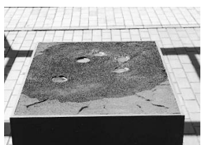
sl.1-3 Faze otapanja djela

I ove se godine Galerija Antuna Augustinčića priključila obilježavanju Međunarodnog dana muzeja izlažući u prostoru stalnog postava djelo koje konceptualno interpretira zadanu temu Muzeji i globalizacija :