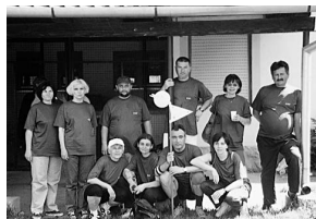
sl.1 Najsportskija ekipa - Muzej Brodskog Posavlja