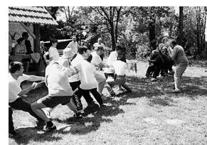
sl.3 Potezanje konopa - favoriti