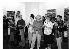
sl.1 S otvorenja izložbe

3 Zlatne, srebrne i brončane medalje učinjene su prenamjenom suvenira Gradskog muzeja Vinkovci - Rimske votivne olovne pločice 2.-3. stoljeća po Kristu .