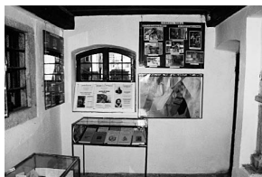
sl.1 Gradski muzej Senj, Izložba: GMS - 1962. - 2002.