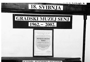
sl.2 Gradski muzej Senj, Izložba: GMS - 1962. - 2002. Senj, detalj

Ove se godine navršava 40. obljetnica osnutka Gradskog muzeja Senj, te je upravo Međunarodni dan muzeja bio odlična prilika za obilježavanje ove značajne obljetnice.