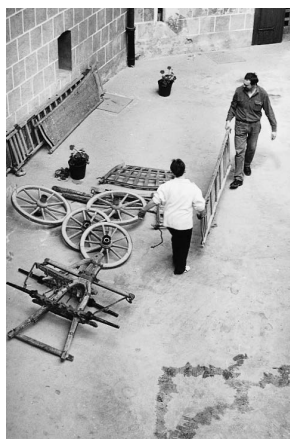
sl.1 Galerija Stari grad Đurđevac, prikupljanje etnografske građe

Izložba u poglavarstvu grada Iloka: U susret novom postavu Muzeja grada Iloka: konzervatorsko - restauratorska