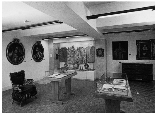
sl.1 Zbirka umjetnina "Kairos" (novi prošireni postav)