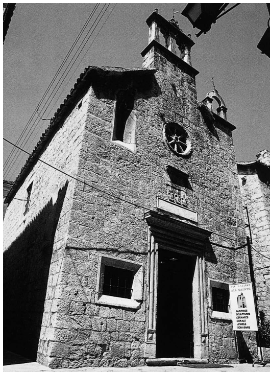
sl.4 Galerija Svi Sveti

Trogira , Informatica Museologica, 1-4, 1987., str. 66-67.