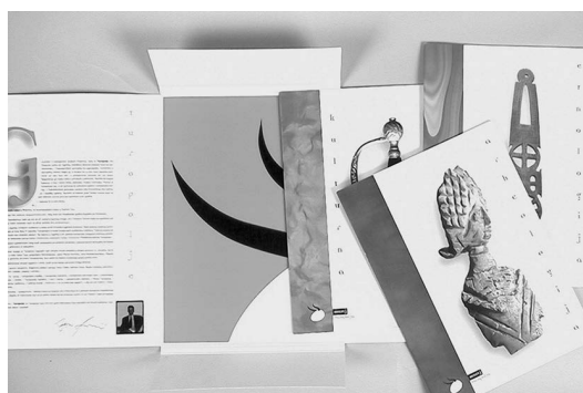
sl.1 Katalog stalnog postava Muzeja Turopolja.