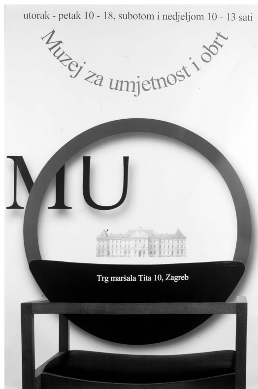
sl.4 City-light plakat stalnog postava MUO, 1998., Ante Rašić Fotodokumentacija Muzeja za umjetnost i obrt, Zagreb

Tek nekoliko godina kasnije, u vrijeme kada je na direk-