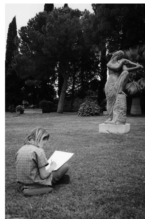
sl.3 Likovna radionica za likovno nadarene osnovnoškolce