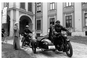
sl.1 Oldtimeri u akciji

SILVIJA LUČEVNJAK □ Zavičajni muzej Našice, Našice