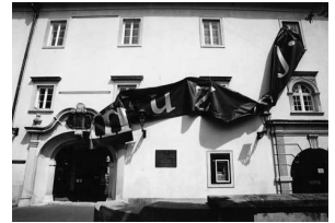
sl.1. Pročelje Klovićevih dvora s intervencijom kiparice Nike Radić

Proslava Dana muzeja u Malom Lošinju ove godine je bila iznimno svečana, a popraćena je četirima izuzetno značajnim muzeološkim akcijama.