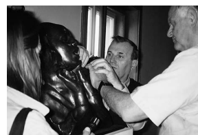
sl.2 Projekt "Dotakni i prepoznaj Meštrovićevo djelo", 17. svibnja 2001.