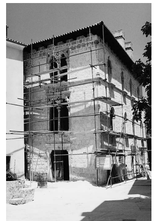
sl.1 Završni radovi na palači Arsan u Cresu