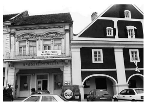
sl.1 Zgrada gradskog muzeja Požega