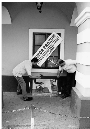
sl.1 Pročelje zgrade Gradskog Muzeja u Vinkovcima na Dan muzeja, snimili: I. Gale, M. Krznarić Škrivanko

Za javne medije i novinare napisan je tekst o akcijama kojima je Gradski muzej Vinkovci popratio Međunarodni dan muzeja.