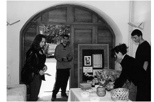
sl.1 i 2 Obilježavanje Dana muzeja u Gospiću