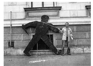
sl.1 Instalaciju Zoltana Novaka pod naslovom "Okupacija" na glavnom pročelju Muzeja za umjetnost i obrt.