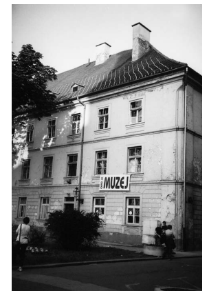
sl.1 "Nova" zgrada muzeja s natpisom: Ovo je Muzej