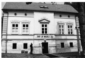
sl.1 Muzej Slavonije Kutina, 18. svibnja 2001.