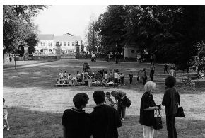
sl.2 Natjecanje u izradi crteža Dvorca Pejačević