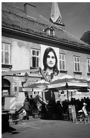
sl.1 Rad Brace Dimitrijevića "Prolaznica koju sam slučajno sreo u 16.04", Zagreb, 2001.