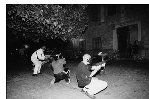
sl.1-3 Obilježavanje Dana muzeja u Muzeju Slavonije, Osijek