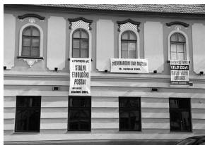
sl.2 Pročelje zgrade Gradskog Muzeja u Vinkovcima na Dan muzeja