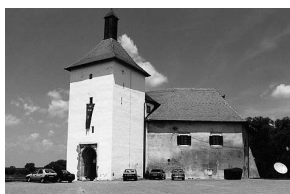
sl.1. Kula utvrde Staroga grada na koju je bila izvješena zelena zastava s natpisom: I mi želimo muzej

U prostoru stalnog postava Galerije, na sam Dan muzeja, bio je izložen uradak kojim se nastojalo za muzeje priskr-