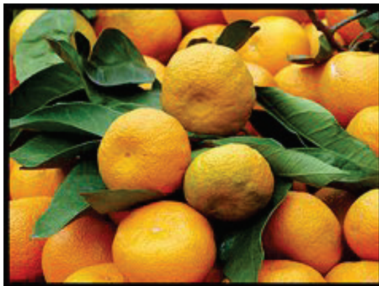
Slika 5: Zreli plodovi mandarine Figure 5: Mature fruits of mandarin

Istraživanje dinamike rodности provedeno je prvom nasadu mandarine Unshiu u dolini Neretve u agrumiku „Pošta“ posadenom 1951. godine na površini od 0,23 ha sa 394 stabla, a rodność je praćena od 1956 – 1972. godine. Rezultati istraživanja dinamike rodności mandarine izneseni su na tablici 2.