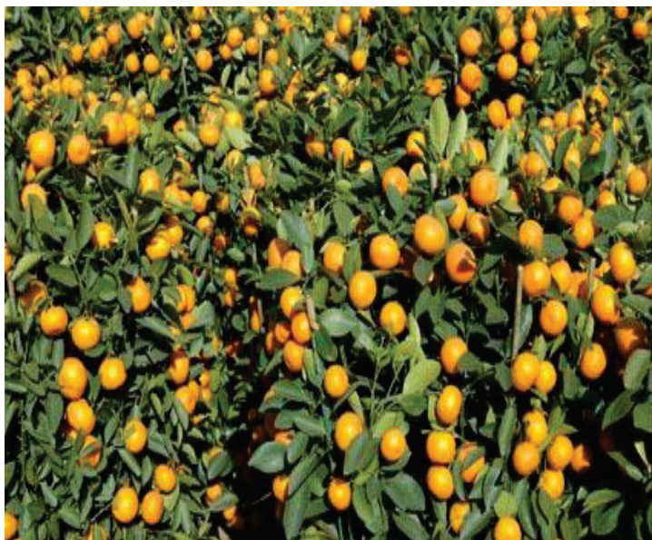
Slika 2: Sorte Unshiu odlikuju se visokom rodnošću Figure 2: The varieties of Unshiu are characterized by high cropping

U Europi, bogati s vladari i vlastela uveli izgradnju „ostakljenih vrtova“ zvanih „oranžerije“ za uzgoj agruma, što je bila velika moda u srednjem vijeku.