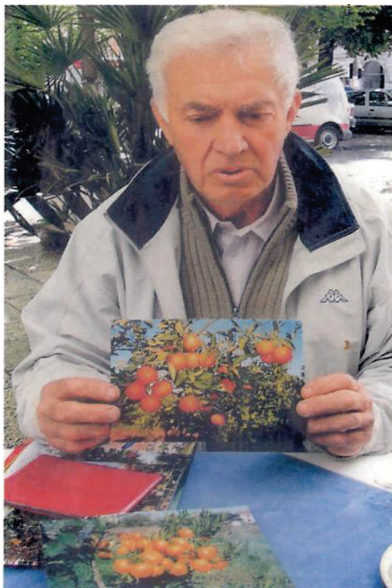
Slika 4: Autor članka predstavlja nove vrste i sorte agruma Figure 4: The author presents a new species and varieties of citrus fruits

Voćnjaci u RH zauzimaju samo 69.000 ha ili 2,2 % ukupnih poljoprivrednih površina. Također su se zbog skupe proizvodnje posebice vode, zaštitnih sredstava i gnojiva primjerice na Braču smanjeni nasadi mandarina za oko 40 %. a i u dolini Neretve se sve više ljudi orijentiraju na manje zahtjevne i jeftinije za uzgoj masline te ostale jednogodišnje kulture povrća. Kod mandarine je naročiti problem u dolini Neretve neriješen sustav natapanja za oko 90 % nasada, te da je isti bolje riješen urod bi mogao biti već za 2-3 puta, a poboljšala bi se i kvaliteta.