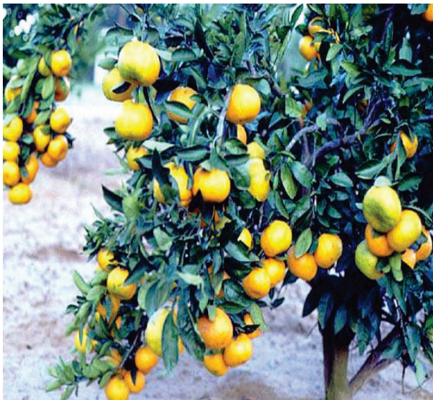
Slika 3: Pod teretom ploda povijene grane krošnje mandarine Figure 3: Under the weight of the fruit twining branches of the crown mandarin