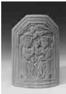
sl. 1 Poljubac mira, slonovača, Flandrija 15. stoljeće, predmet iz Zbirke srednjovjekovnih predmeta od slonovače, Muzej Mimara

ANICA RIBIČIĆ-ŽUPANIĆ □ Muzej Mimara, Zagreb