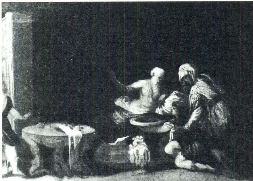
Andrija Medulić, Historija o Tobiji (detalj), Strossmayerova galerija, Zagreb

No čini se da su profili Sustrisa , del Mora , kao i Bonifazia već dovoljno utvrđeni, tako da možemo dovoljno točno razgraničiti opus našeg Schiavona . 9