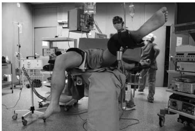
SLIKA [1] Priprema bolesnika za operacijski zahvat.