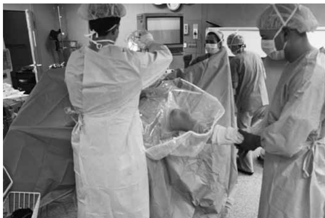
SLIKA [3] Sterilno pokrivanje operacijskog polja.

Nakon kirurškog pranja i sterilnog pokrivanja operacijskog polja [Slika 3] slijedi spajanje aparature za izvršenje operacijskoga zahvata (elektrokoagulacija, artroskop, sukcijska irigacija...).