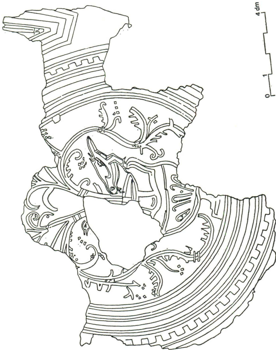
Stari Grad, Crtež mozaika (crtao B. Pavazza)