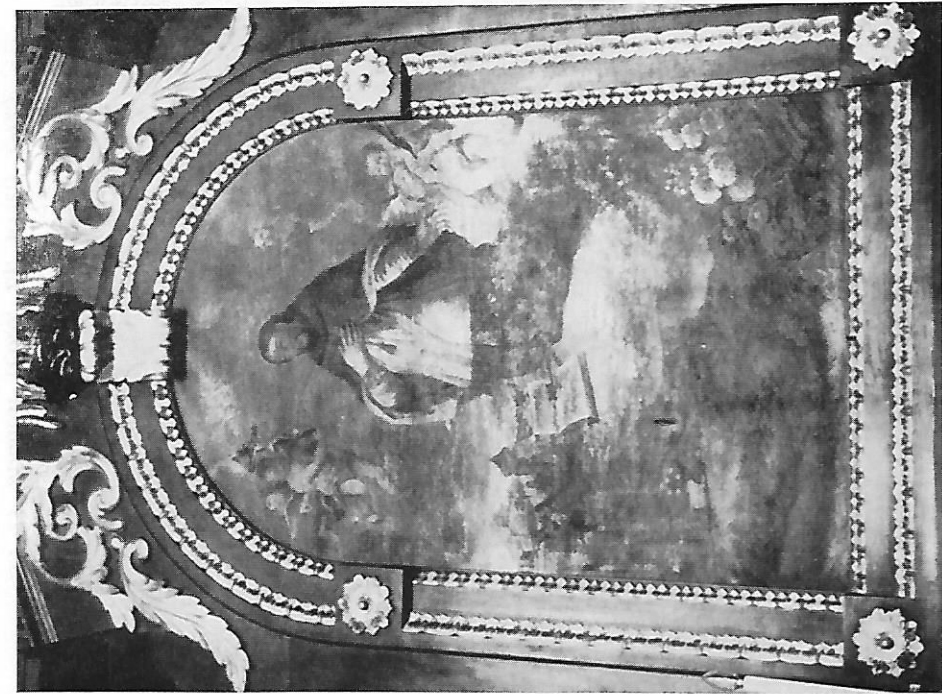
Sl. 15 Uršulinski samostan: Oltarna pala Stjepana Lypoldta