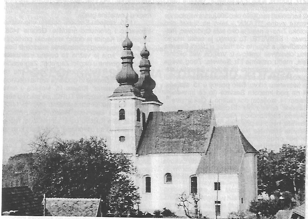
SESVETSKA CRKVA 1990.

Iz ovoga vidimo da selo Sesvete i sesvetska crkva u 1334. godini imaju vrlo povoljan položaj, leže uz dvije vrlo važne prometnice toga vremena, trgovačko-strateške, uz plodno zemljište vrlo povoljno za razvoj poljoprivrede. Ako prolaz između Samoborskog gorja i Medvednice, uz Savu, kojim "Magna Strata" ili "Magna Via" ide prema Zagrebu, možemo nazvati "zapadnim vratima" zagrebačke županije, onda možemo reći da su Sesvete "istočna vrata" zagrebačke županije i ne čudi nas da je ban Mikac 1343. ovdje postavio kraljevsku mitnicu 11 . Sve to nam daje indicije da su Sesvete i sesvetska crkva još stariji, što ćemo pokušati dokazati još nekim povijesnim izvorima i dokumentima.