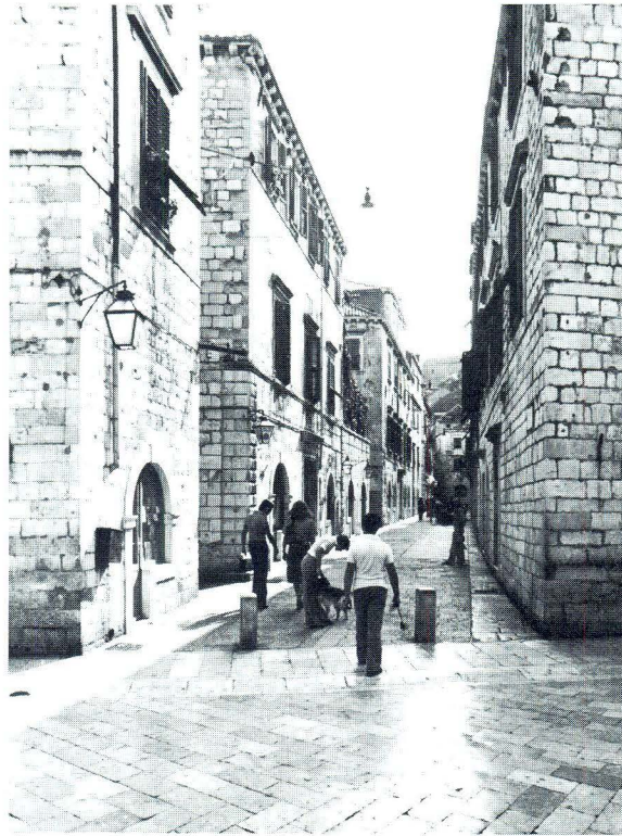
Dubrovnik, Široka ulica

cu, 37 kao najvažniji prostor komunalne uprave. Prostori klaustara samostanâ, 38 osobito onih franjevacâ i dominikanaca, zatim ulična proširenja ispred manjih crkvenih građevina te hospitala, 39 bolnica, ubožnica predstavljaju isto javne prostore srednjovjekovnog Dubrovnika. Prostori izvan zidina grada, a u njihovoj blizini, kao što je lučki dio, te dio uz vrata od Ploča, kao i onaj uz gradska vrata od Pila, pripadaju važnim javnim prostorima srednjovjekovnog Dubrovnika. Uvučeni dijelovi luke 40 uz kneževu utvrdu, kasniji dvor na južnom dijelu, te dio ribarnice u blizini carinarnice na sjevernom dijelu spadaju u najživlje prostore grada ovog razdoblja. U središnjem dijelu postoje arsenali i predio brodogradilišta.