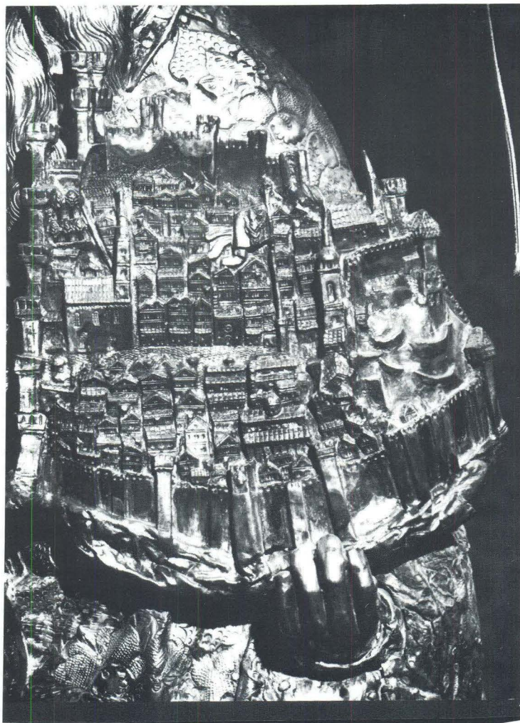
Model grada, sredina XV. stoljeća — kip sv. Vlaha

uagina. Item tenalie cum fercentis et una capsula de buso. Item unum carne- rium de panno cum uno pectine intus. Item unum speculum de Veneciis et unus lapis ad acuendum cum vagina. Item unum par de lançetis cum duobus ferra ad minuendum sanguinem. Item una caseluça de busa ad cenendum ferra ad minuendum sanguinem. Item unus maleus de ferro, due pecie parue de sapone. Item unus saculus parvus in quo erant V solidi grossi et nouem de- narii de Veneciis parui. Et dictus saculus erat in uno cyroteca. — Pro nichilo (Spisi Dubrovačke kancelarije, knj. III — Zapisi notara Tomazina de Savere 1284—86. Diversa cancellariae II—1284—86. — Zapisi notara Aca de Titullo 1295—97. — Diversa cancellariae III—1295—97. Pripremio i prepisao dr J. Lu- čić, Zagreb 1988.)