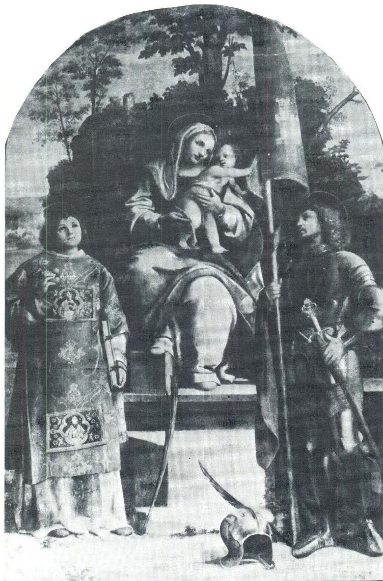
Lorenzo Luzzo, Bogorodica sa svecima Vittoreom i Stjepanom, Berlin, Gemädegalerie Državnog muzeja.