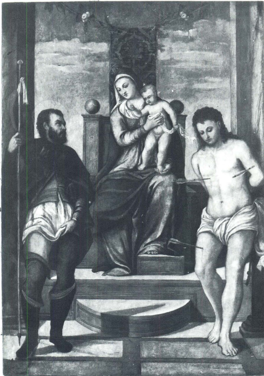
Lorenzo Luzzo, Bogorodica sa svecima Rokom i Sebastijanom, Trogir, katedrala