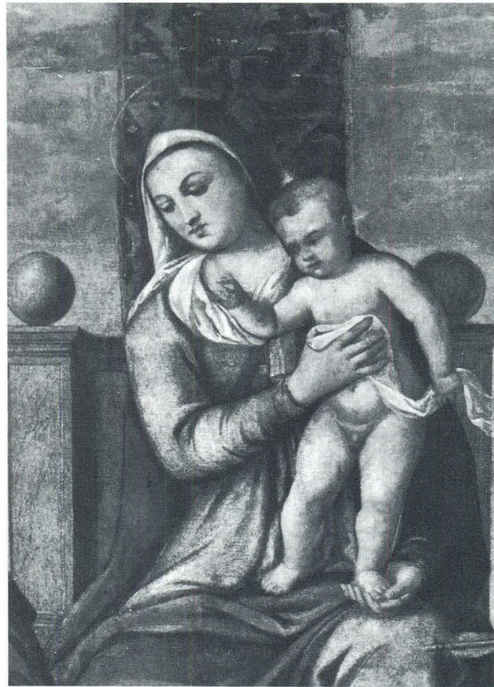
Lorenzo Luzzo, Bogorodica sa svecima Rokom i Sebastijanom, Trogir, katedrala, detalj

Osobito na temelju Luzzove pale »Bogorodice između sv. Viktora i sv. Stjepana« u Gemalde-galerie Državnog muzeja u Berlinu, a porijeklom iz crkve sv. Stjepana u Feltreu, potpisane i datirane 1511. godine,