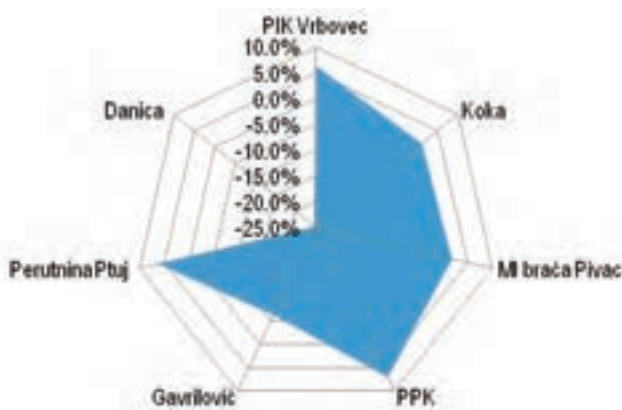
Slika 2. Promjena prihoda mesne industrije (2012-2013.).

Drugi kriterij rangiranja tvrtki je Prilagođenost promjenama tržišnih uvjeta koji je određen promjenom prihoda u 2013. u odnosu na 2012. godinu. Rezultati tvrtki pokazali su da su one uglavnom spremno dočekale promjene uvjeta poslovanja pa su, ne samo zadržale, već i povećale prihode u prvoj godini članstva Hrvatske u Uniji. Osim Gavrilovića (-6,3%) i Danice (-24,5%) sve su ostale analizirane tvrtke u 2013. povećale prihode u odnosu na prethodnu godinu. Najveći rast prihoda ostvarila je PPK karlovačka mesna industrija od 6,9%.