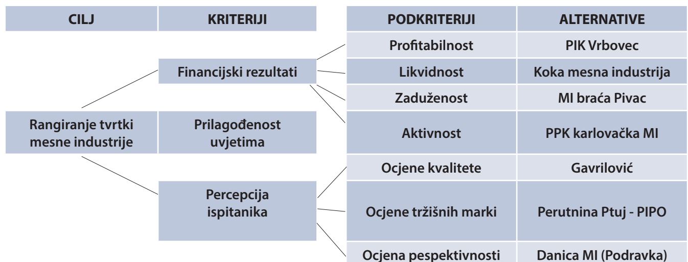
Slika 1. AHP model usporedbi tvrtki mesne industrije

U ovom je radu korištena sljedeća struktura AHP mode-