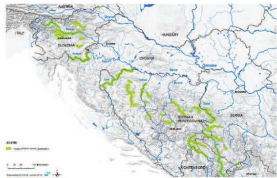
Slika 1. Rasprostranjenost samoodrživih populacija mladice na području Balkanskog poluotoka

te vrste. Središnja područja, koja predstavljaju najveće i najzdravije populacije mladica uključuju rijeku Savu i njezine pritoke u Sloveniji, rijeku Kupu duž hrvatske-slovensko granice, rijeku Unu na hrvatsko-bosanskohercegovačkoj granici, gornju Drinu i njezine pritoke u Bosni i Hercegovini i Srbiji, te rijeku Lim u Crnoj Gori. U Republici Hrvatskoj stabilne populacije mladice nalazimo u rijeci Kupi na graničnom području sa Slovenijom u dužini toka od 102 km, te u rijeci Uni na graničnom području sa Bosnom i Hercegovinom, u dužini toka od 122km (Slika 1).