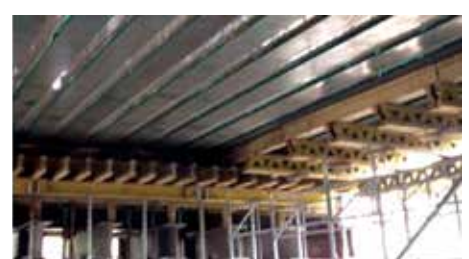
Slika 5. Montaža i izrada raspanske konstrukcije