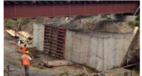
Slika 2. Ojačanje temelja i zidova upornjaka

hodno su pripremljeni, geometrijski nadvišeni od 11 do 28 mm, ovisno o rasponu konstrukcije. Kao izgubljena oplata između HEM nosača korištene su polipropilenske ploče visine 15 mm. Rasponski sklop naguravao se hidrauličnim prešama koje su potiskivale rasponsku konstrukciju, opirući se o tračnice za koje su fiksirane vijcima i pomicanje za duljinu klipa hidraulične preše.