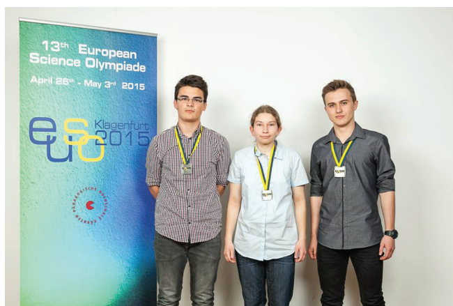
Slika 2 – Hrvatski natjecatelji poslije ceremonije zatvaranja Olimpijade s osvojenim srebrnim medaljama

(Biološka olimpijada (IBO), Kemijska olimpijada (IChO) i Fizička olimpijada (IPhO)).