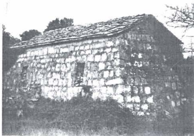
Sl. 4. Novija peć Fig. 4. Newly furnace

riješiti pitanje očuvanja i eventualne obnove rudarske baštine? Smatramo da rudnik dopunjen rudarskim alatom može služiti za znanstveno-nastavne i turističke svrhe. To ovisi o Turističkom društvu otoka Brača i "Jadrankamenu" iz Pučišća. Nastavnici Rudarsko-geološko-naftnog fakulteta sigurno će neposredno pomoći u ostvarivanju te zamisli, koja je od velikog značenja za rudarsku baštinu Hrvatske. S obzirom na dobru očuvanost stare jame i novih niskopa, kao i relativno dobru očuvanost pratećih