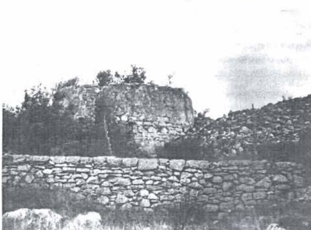
Sl. 3. Ostaci okrugle peći Fig. 3. Remains of round furnace

Kakva će biti buduća namjena rudnika i kako