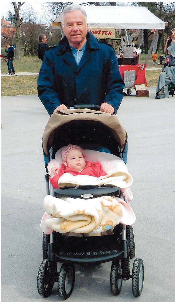
Uživanje s unukom

časa, a preko 35 godina bio sam liječnik prof. Bonaventure Dude od kojeg sam naučio mnogo prekrasnih životnih spoznaja. U pamćenju će mi zauvijek ostati poziv zabrinutog oca čija se kćer, tad gimnazijalka, zaključala u kupao- nu ne puštajući nikog k sebi, osim mene kao njihova obiteljskog liječnika. U kupaoni me dočekao veoma stresan prizor – djevojka je sjedila u kadi, a između njezinih nogu na pupkovini nalazilo se novorođenče. Iako je sve prošlo u najboljem redu, bio sam strašno