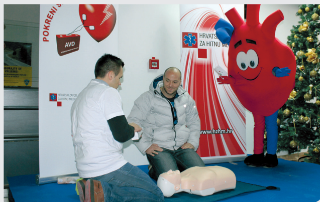
Promocija javno dostupne rane defibrilacije u I. postaji prometne policije Zagreb

U I. postaji prometne policije u zagrebačkoj Heinzelovoj ulici građani su u prosincu 2013. imali priliku, uz izdavanje prometnih isprava, naučiti pravilno izvesti vanjsku masažu srca i umjetno disanje te pružiti prvu pomoć uz uporabu AVD-a. Velik broj Zagrepčana privukla je mogućnost da sami pokušaju izvesti postupak oživljavanja uz upotrebu AVD-a. Ovom promocijom, Hrvatski zavod za hitnu medicinu upozorio je građane na problem učestalosti iznenadnog srčanog zastoja te im ukazao na važnost poznavanja osnovnih mjera održavanja života odraslih uz uporabu AVD-a.