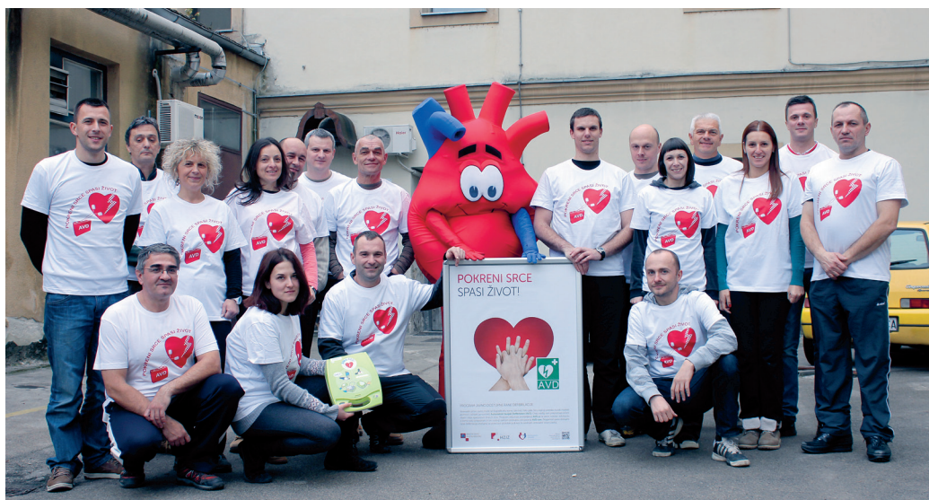
Vodiči Stanice planinarskih vodiča Karlovac Hrvatskog planinarskog saveza

što potvrđuje primjer koji prenosi ABC News 10 . Naime, naučivši postupke oživljavanja iz videa s YouTubea, Mitch Thrower, poslovni čovjek iz Kalifornije, spasio je život starijoj putnici koja je na letu iz New Yorka u San Diego doživjela iznenadni srčani zastoj. Uz Mitcha, nesretnoj putnici u pomoć je priskočila i stjuardesa s AVD uređajem, nakon čije primjene je putnica došla svijesti te je uspješno zbrinuta u lokalnoj bolnici u St. Louisu.