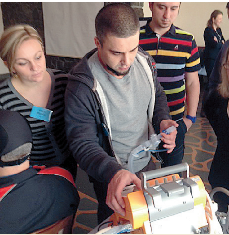
Neinvazivna mehanička ventilacija

SLUŽBENO GLASILO HRVATSKOG ZAVODA ZA HITNU MEDICINU