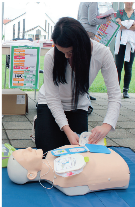
Promocija programa "Pokreni srce-spasi život" u Karlovcu

Hrvatskog indeksa prijema hitnog poziva za medicinsku prijavno-dojavnu jedinicu, daje medicinski dispečer.