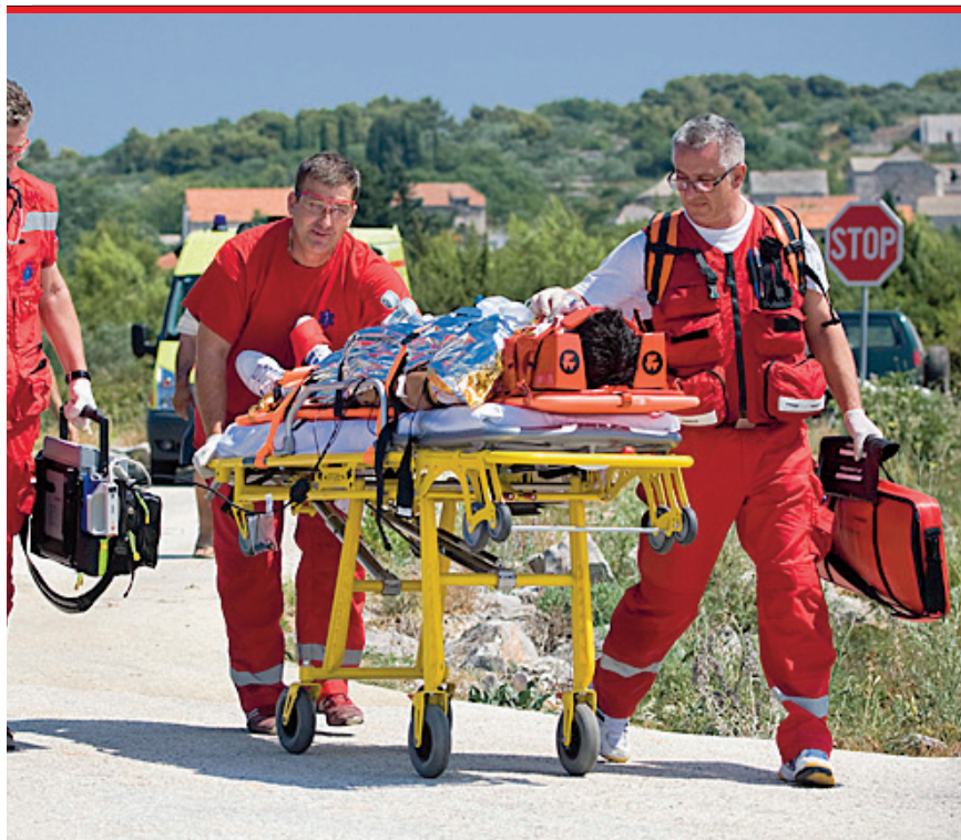
Tim HMS-a zbrinjava hitnog pacijenta