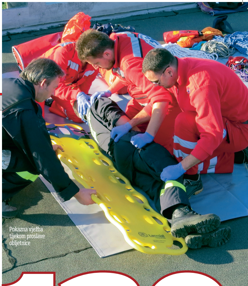
Pokazna vježba tijekom proslave obljetnice

Podsjetimo, Hrvatski sabor je prošle godine jednoglasnom odlukom dan 30. travanj proglasio Nacionalnim danom HMS-a. Tom odlukom hrvatska HMS pridružila se nizu svjetskih zemalja koje obilježavanjem Dana hitne medicine nastoje senzibilizirati javnost o važnostima i specifičnostima ove iznimno odgovorne i teške djelatnosti te potaknuti građane da ispravnim postupcima pozivanja hitne službe doprinesu boljem zdravstvenom ishodu unesrećene ili oboljele osobe. ■