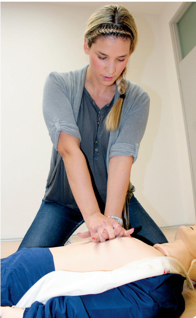
Edukacija daje samopouzdanje i spremnost pružanja pomoći

Zasad je nabavljeno 197 AVD uređaja koji su isporučeni partnerskim institucijama na projektu „Pokreni srce-spasi život“. Ministarstvu pomorstva, prometa i infrastrukture isporučena su 52 AVD uređaja, 43 uređaja dobilo je Ministarstvo unutarnjih poslova, 15 Ministarstvo obrane, 11 Ministarstvo zaštite okoliša i prirode, osam Hrvatska gorska služba spašavanja, deset Državna uprava za zaštitu i spašavanje, dok je 20 AVD uređaja dodijeljeno vatrogasnim postrojba-