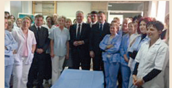
Ministar zdravlja prof. dr. sc. Rajko Ostojić, dr. med. s djelatnicima HMS-a Tomislavgrad

Donirana oprema sastoji se, među ostalim, od aspiratora, defibrilatora, EKG uređaja, stolice za transport pacijenata, rasklopnog nosila i druge opreme nužne za zbrinjavanje hitnih pacijenata. Akciju za prikupljanje opreme za HMS u Tomislavgradu inicirali su Ministarstvo zdravlja i Hrvatski zavod za hitnu medicinu, a donacijama su se odazvali županijski zavodi za hitnu medicinu