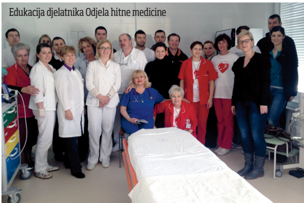
Edukacija djelatnika Odjela hitne medicine

Edukacija je, u organizaciji Hrvatskog zavoda za hitnu medicinu i Opće županijske bolnice Našice, sadržavala niz interaktivnih radionica poput održavanja prohodnosti dišnog puta, temeljnih postupaka održavanja života, sigurne defibrilacije te provođenja postupaka naprednih mjera održavanja života. Ukupno 25 polaznika uvježbalo je strukturirani pristup hitnom pacijentu uz korištenje suvremene opreme u hitnoj medicini. Strukturirani pristup zbrinjavanja hitnog pacijenta osigurava standardiziranu i kvalitetnu skrb u Odjelu hitne medicine. ■