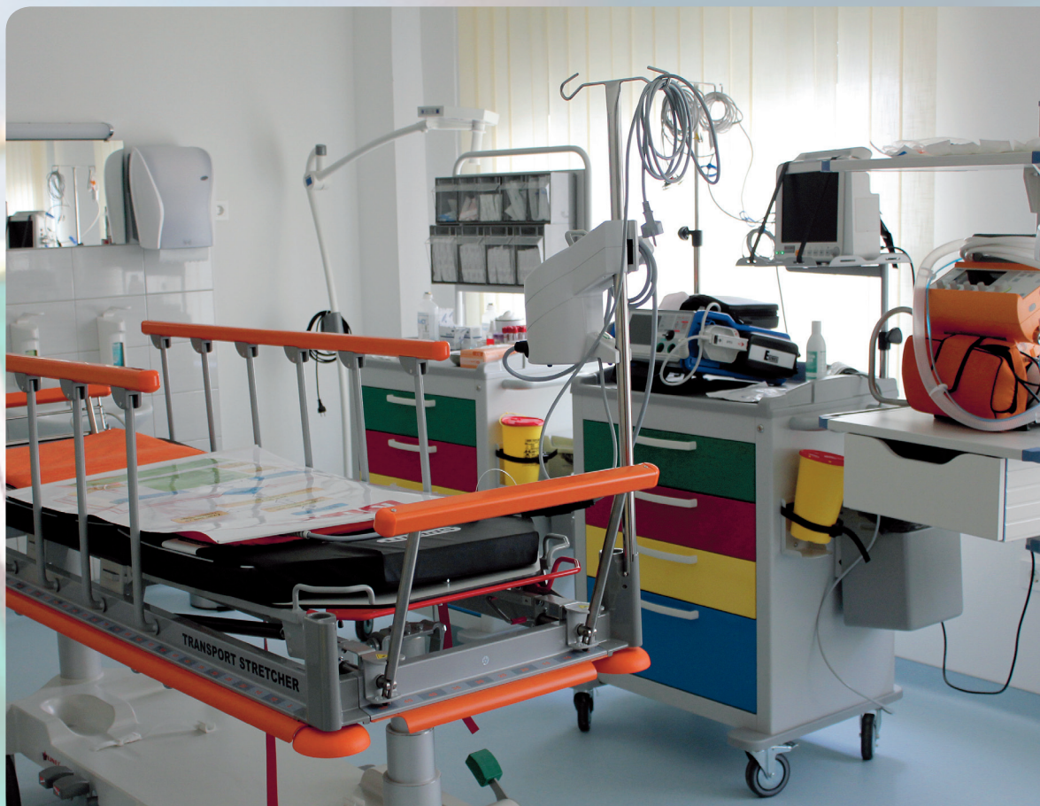
Sala za reanimaciju

hitne medicine dio je Projekta unapređenja hitne medicinske službe i investicijskog planiranja u zdravstvu kojeg provodi Ministarstvo zdravlja uz pomoć zajma Međunarodne banke za obnovu i razvoj. Ukupno je u unapređenje bolničke hitne medicinske službe uloženo 70 milijuna kuna.