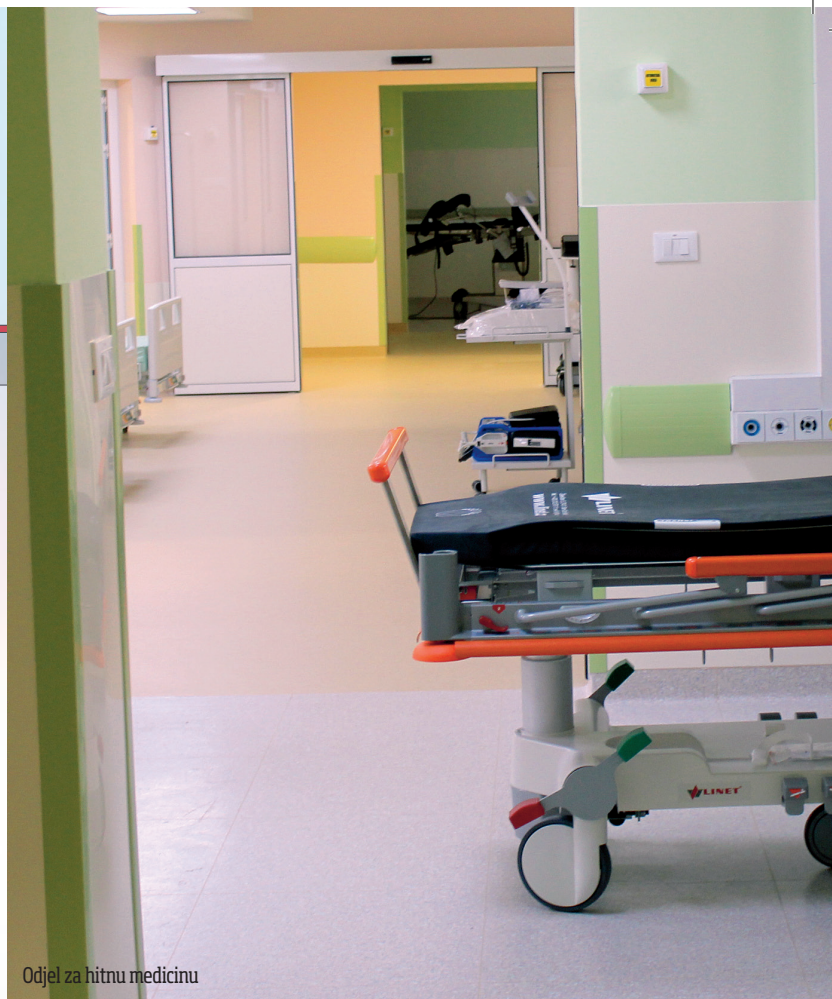
Odjel za hitnu medicinu