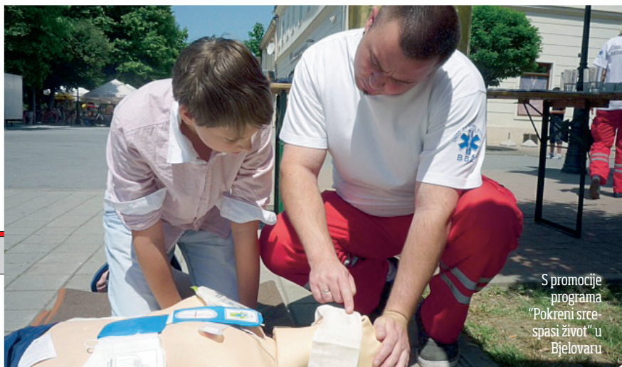
S promocije programa "Pokreni srce-spasi život" u Bjelovaru