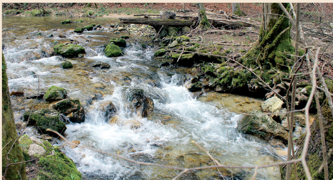
Park prirode Žumberak-Samoborsko gorje