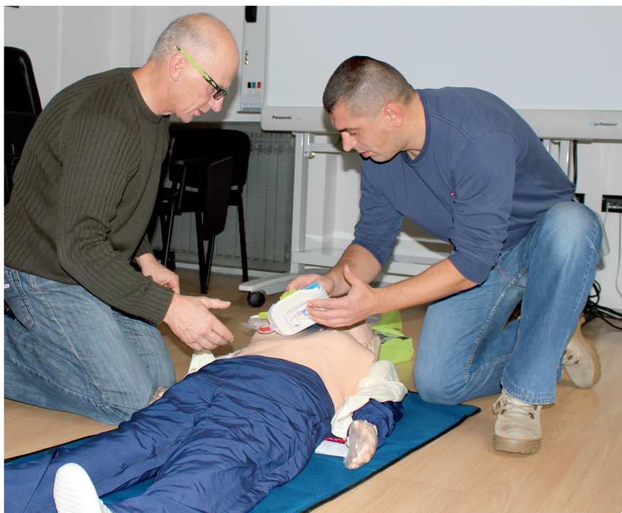
Edukacija djelatnika Ministarstva unutarnjih poslova

Iznenadni srčani zastoj može se dogoditi bilo kome, bilo kad i bilo gdje. Srcu koje je prestalo kucati možete pomoći i oživjeti ga koristeći Automatski Vanjski Defibrilator (AVD) . Ovaj uređaj sam prepoznaje srčani ritam i daje spasonosni impuls srcu. Program uključuje postavljanje AVD-a na javna mjesta i edukaciju o tome kako prepoznati srčani zastoj i samom postupku oživljavanja AVD-om. Programom javno dostupne rane defibrilacije značajno se povećava postotak ljudi koji će preživjeti iznenadni srčani zastoj.