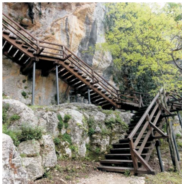
Slika 3. Početak dionice D-5 s drvenim stepenicama učvršćenim u strmu liticu

Figure 3 Beginning of section D-5 with wooden steps fixed in the steep cliff