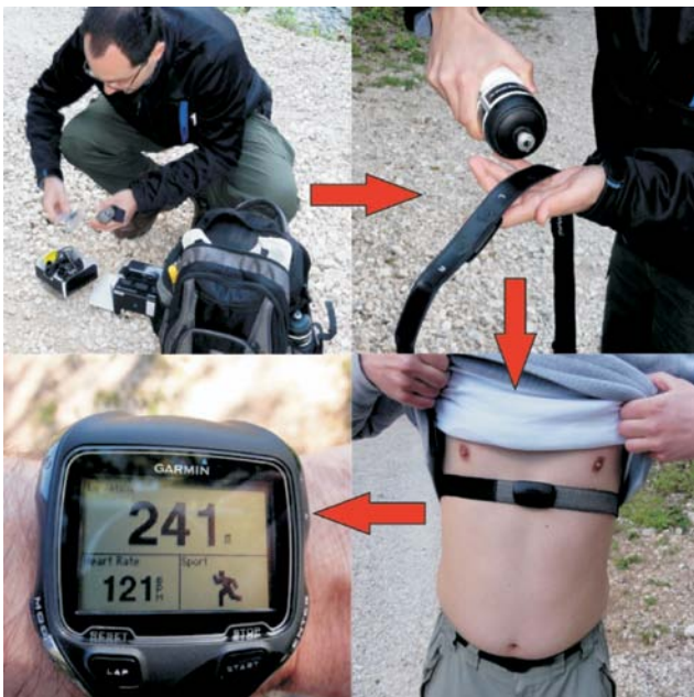
Slika 2. Postavljanje uređaja Garmin F910 za mjerenje frekvencije srca Figure 2 Setting up the Garmin F910 for measuring heart rate

Za ocjenu fizičkog opterećenja pri svladavanju pješačke staze primijenjena je metoda mjerenja frekvencije srca 4 (pulsa) koje je provedeno na ispitanicima pomoću uređaja Garmin Forerunner 910XT (dalje: GarminF910). Za svaku dionicu staze obavljena su mjerenja na tri ispitanika, a dodatno na D-5 dionici staze na uzorku od 22 ispitanika. Prije terenskog mjerenja za svakog ispitanika određeni su sljedeći parametri: spol, visina (u cm), tjelesna masa (u kg), frekvencija srca u odmaranju ( FS_o ) i maksimalna teorijska frekvencija srca ( FS_{max} ). Frekvencija srca u odmaranju utvrdila se individualnim brojanjem otkucaja srca u trajanju od 1 minute (a) ujutro nakon buđenja ili (b) na mjestu mjerenja poslije 20 minuta bez aktivnosti (mirovanje). Maksimalna teorijska frekvencija srca izračunala se po formuli FS_{max} = 210 - (0,65 \times \text{godine života}) (Heimer i dr. 1997). Tako određeni osobni parametri činili su tzv. ulazni profil ispitanika koji je prije početka terenskog mjerenja, za svakog ispitanika, unesen u memoriju Garmin F910.