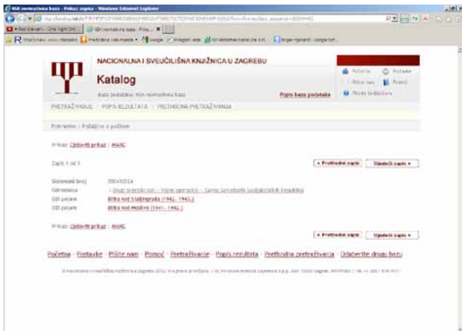
Slika 1. Normativni zapis u online katalogu NSK