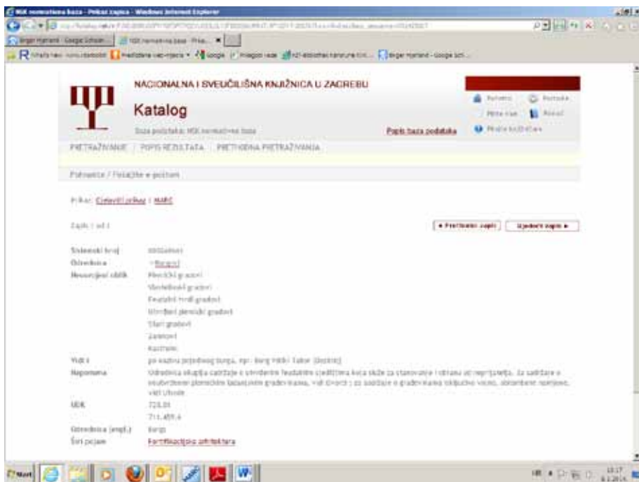
Slika 2. Normativni zapis odrednice za opći pojam Burgovi u online katalogu NSK s napomenom za korisnike (MARC polje 680)