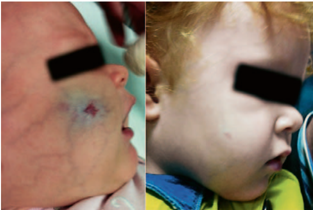
SLIKA 1. Lijevo prije terapije propranololom, desno nakon nje

rasta hemangioma desnog obraza koji prijeti bitnim estetskim nagrđivanjem. Stoga se u terapiju ponovo uvodi propranolol per os u dozi od 2 mg/kg/dan razdijeljeno u tri davanja koji uzima četiri mjeseca uz vidljiv izvrstan terapijski odgovor. U Hitnu službu Klinike donešena je djevojčica u dobi od 26 mjeseci, nepokretna, pri pregledu izrazito pospana, teško se razbuđivala. Mjerene vitalne funkcije: RR 110/60 mmHg, SaO 2 98%, puls 100 u min. Odmah izmjerena glukoza u krvi na glukometar pokazuje oznaku low (nisko), naknadno nalaz iz laboratorija vađenjem kapilarne krvi daje nalaz glukoze u krvi 1,1 mmol/L. Postavljen je venski put uz parenteralno davanje 10% otopine glukoze, nakon čega se dijete odmah razbuđuje, traži jesti i piti.