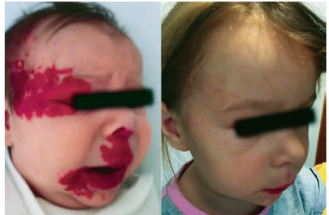
SLIKA 2. Lijevo prije terapije propranololom, desno nakon nje

Žensko dojenče u dobi od 2,5 mjeseca prvi put je primljeno u našu Kliniku zbog segmentalnog plaque-like hemangioma desne strane lica u proliferativnoj fazi rasta, koji zahvaća desno oko i ulcerira središnji dio donje usne (Slika 2). Kako je riječ o segmentalnom hemangiomu na licu, većem od 5 cm u promjeru s tipičnom distribucijom za PHACE sy. ( posterior fossa abnormalities, hemangioma, arterial/aortic anomalies, cardiac anomalies, eye abnormalities and sternum/supraumbilical raphe ), obavljena je magnetska rezonancija mozga s angiografijom kojom se isključe moguće povezane anomalije središnjeg živčanog sustava kao i pridružene anomalije krvnih žila mozga. Nalaz upućuje na to da je desni očni bulbus okružen nepravilnom strukturom povišenog intenziteta signala na T2 mjerenoj slici, koja je najdeblja kranijalno i me-