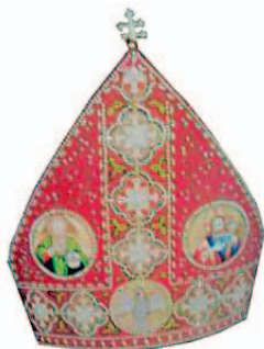
Sl.15 Mitra, 1877. god., izradile Sestre milosrdnice