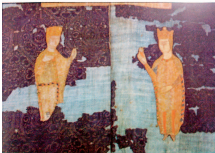
Sl.9 Ladislavov plašt – misnica (detalj), 11. st.

Humeral, tzv. naramenik biskupa Augustina Kažotića, potječe iz Francuske ili Italije iz oko 1300. god. Nekad se oblačio na misnicu, te bio bogato ukrašen. Današnji humerali su izrađeni od platna i nemaju nikakvih ukrasa, te se nose ispod albe. Iz Lucerne ga je donio u Zagreb biskup Mikulić, a odiše duhom zapadnoeuropske gotike. Vez mu je plošni zlatovez na lanu, kojim se nastoji postići