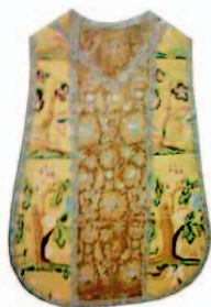
Sl.21 Misnica, vez iz Hrvatske, početak 18. st. [12]