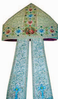
Sl.16 Mitra, oko 1900. god., izradile Sestre milosrdnice

zlatovez i raznobojni vez u tragovima na lanenom platnu, sl.17. Vrsta veza i pozlaćene niti su identični, a i lanena kontura ispod njih uglavnom im odgovara, tako da vjerojatno datiraju iz istog vremena kao i sam križ. U starom muzejskom inventaru navedeno je da križ potječe iz Zadra, iz obitelji Gavalla. Križ je originalno bio na vrlo oštećenoj podlozi od crvenog baršuna, koja je kasnije u muzeju zamijenjena novim svilenim atlasom.