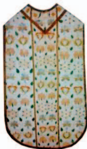
Sl.18 Misnica, poč.17.st. (slika s izložbe Liturgijsko ruho iz zbirke tekstila Muzeja za umjetnost i obrt)

Sl.18 prikazuje misnicu s početka 17. st., čiji je vez tzv. arapski bod na bijeloj lanenoj podlozi. Cijela površina misnice prekrivena je stiliziranim cvjetovima simetrično složenim tako da sugeriraju vertikalne nizove. Horizontalni raspored postiže se sa dva jednaka cvijeta koji se nižu jedan do drugoga