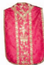
Sl.14 Misnica, Hrvatska, kraj 18. st.

Najstariji primjerak iz Hrvatske je vez s kraja 14. st. t.j. izvezeni križ, dok su grbovi na njemu iz druge polovice 16. st. Tamnocrveni svileni atlas je podloga, a vez je reljefni i plošni