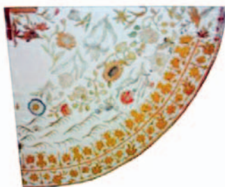
Sl.19 Plašt (detalj), Zagreb, druga pol. 17 st., vezilačka radionica Stolla (slika s izložbe Liturgijsko ruho iz zbirke tekstila Muzeja za umjetnost i obrt)

unutar vertikalnih polja omeđenih uskim pozlaćenim bortama.