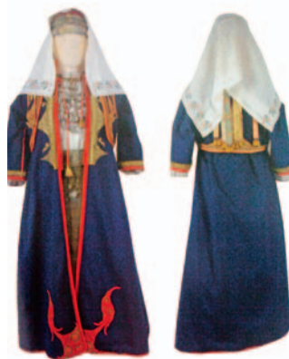
Sl.5 Mladenkina nošnja dinarskog tipa, Ošlje, sredina 19. st.

obično obojene modro, a oko struka ovijen je vrlo dug pas [10]. Muška nošnja ima srmene trake boje zlata, najviše na svečanim prslucima te nešto manje na kratkim kaputima.