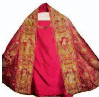
Sl.12 Pluvijal, Zagreb, 1663. god.

restauriran prije njegovog izlaganja u Parizu, 1971. god.