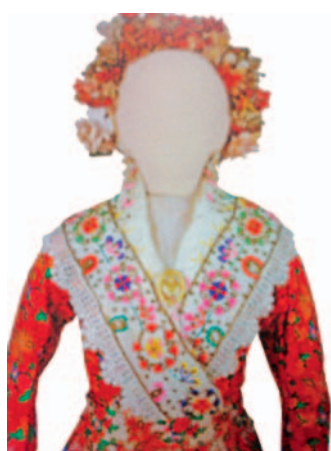
Sl.1 Mladenkina nošnja jadranskog tipa, Dubrovačko primorje, poč. 20. st.

Srma je primijenjena na jadranskoj nošnji i kao sastavni dio muških dolcoljenica, kako je pronađeno u Etno-