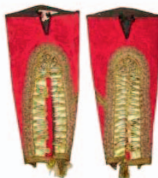
b) stražnja strana