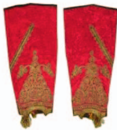
a) prednja strana