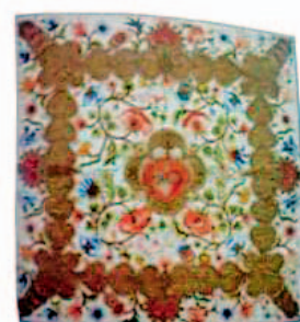
Sl.20 Velum, Hrvatska, 1725. god., Benediktinski samostan Rijeka, početak 18. st. [12]

Ima još nekoliko misnica za koje se pretpostavlja da su iz Hrvatske, jedna je s početka 19. st., ali nemaju srmenih niti tako da nisu predmet ovog rada.