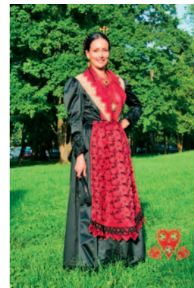
Sl.8 Varoška nošnja (Split)

Za izradu crkvenog tekstila koristile su se tkanine koje su se specijalno tkale za tu svrhu, dok su rjeđe korištene i tkanine za svjetovnu odjeću. Do kraja 17. st. Italija je imala vodeću ulogu u proizvodnji svilenih tkanina u Europi. Nakon toga proizvodnja se