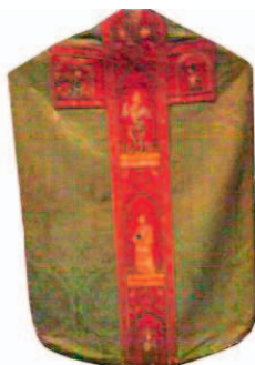
Sl.10 Misnica, 15. st., (slika iz knjige Riznica Zagrebačke katedrale) (snimila K. Šimić)

Riznica zagrebačke katedrale čuva dragocjen fond paramenata tj. crkvenog ili liturgijskog ruha kroz sva duga stoljeća njegova postojanja. Najstariji parament, „Ladislavov plašt“, misnica je iz davnog 11. st. Misnica je, iako