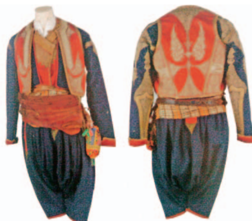
Sl.2 Muška svečana nošnja, Dubrovačko primorje, kraj 19. st.