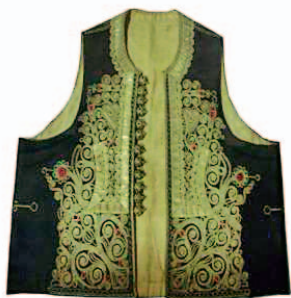
Sl.4 Ženski prsluk s terzijskim vezom, jačerma, Konavle, 19. st.

Muška nošnja povrh nezaobilazne platnene košulje stavlja suknenu prsluk kojem se prednji dijelovi preklapaju. U svečanim prilikama preko njega se navlači još jedan prsluk zvan jačerma, koji postoji i u jadranskoj narodnoj nošnji, a izrađen je od kupovne čohi i bogato ukrašen srebrnim ili pozlaćenim metalnim aplikacijama. Hlače su od valjanog sukna,