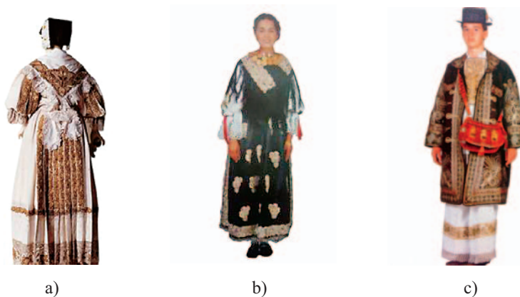
Sl.6 Najsvečanija a) i b) ženska nošnja Slavonije, c) muška nošnja, okolica Vinkovaca

zlatnim i srebrnim gajtanima ukrašen dugački ogrtač od sukna. Tako je izgledala najsvečanija muška nošnja iz okolice Vinkovaca, sl.6c).