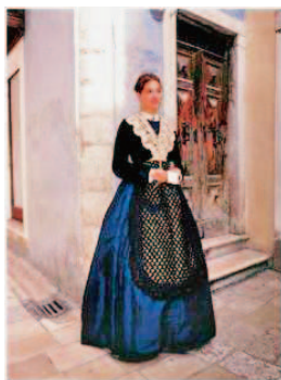
Sl.7 Svečana pučka nošnja, Zadar, II. polovica 19. st.

Alkarušin struk naglašava pojas složen od dviju srmenih traka. Zadnja se oblači dolama, tj. haljetak dugih rukava izrađen od fine modre čohe. Luksuzni dojam nošnji daju bijele ruka-