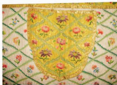
Sl.13 Dio dalmatike, Beč, 1775. god.

Iz razdoblja od 1787. do 1827. god. dio je misnog ornata koji je dao izraditi biskup Maksimilijan Vrhovac. Sastoji se od misnice, mitre, veluma i stole izrađenih u Hrvatskoj krajem 18. st. Misnica ima tkaninu od svilenog damasta, ljubičaste boje, a vez je od raznovrsnih srebrnih folija. Po sredini misnice je stup omeđen reljefnom srebrnom vezenom bortom, oko