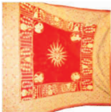
Sl.11 Pokrivalo iz 16. st.

Na sl.12 prikazan je pluvijal crvene boje iz 1663. god., vez je reljefni figuralni zlatovez, a tkanina srebrom i zlatom protkani brokat. Taj je pluvijal