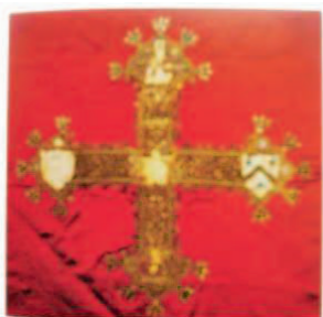
Sl.17 Vez s kraja 14. st., Hrvatska (slika s izložbe Liturgijsko ruho iz zbirke tekstila Muzeja za umjetnost i obrt)