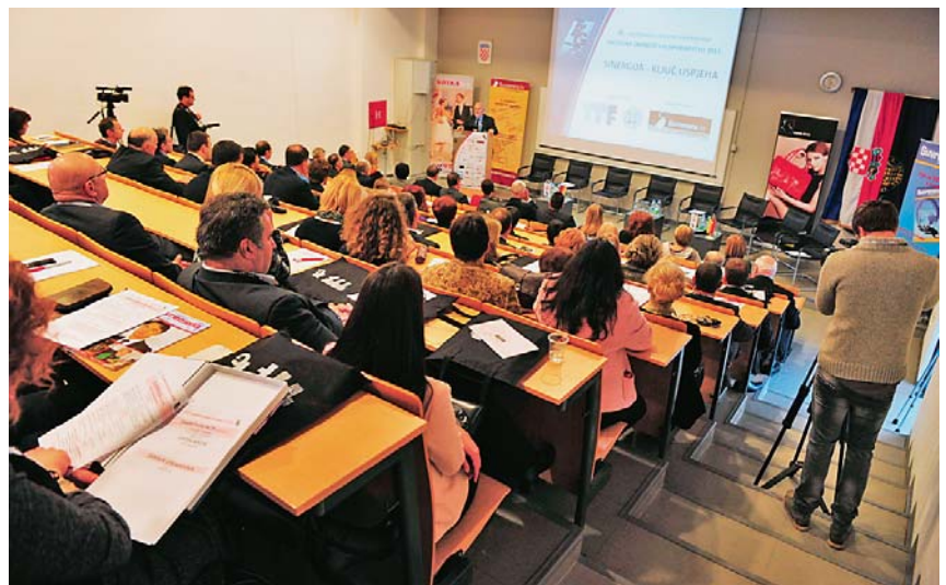
Sl.1 Otvaranje znanstveno-stručnog savjetovanja Tekstilna znanost i gospodarstvo