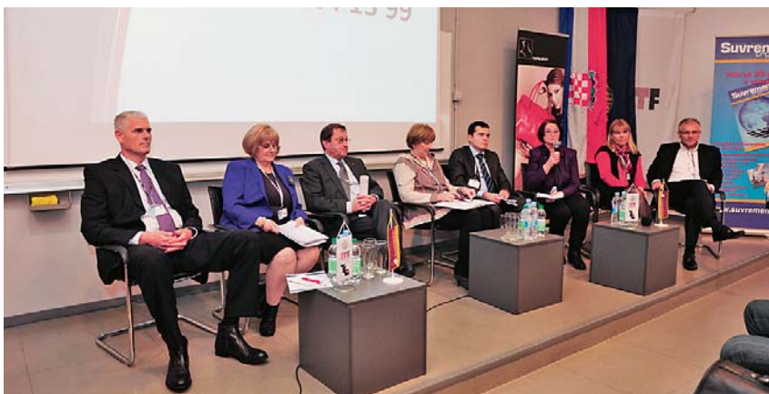
Sl.3 Panel rasprava

Savjetovanje su medijski popratili Lider, Poslovni dnevnik, Privredni vjesnik i Televizija Student.