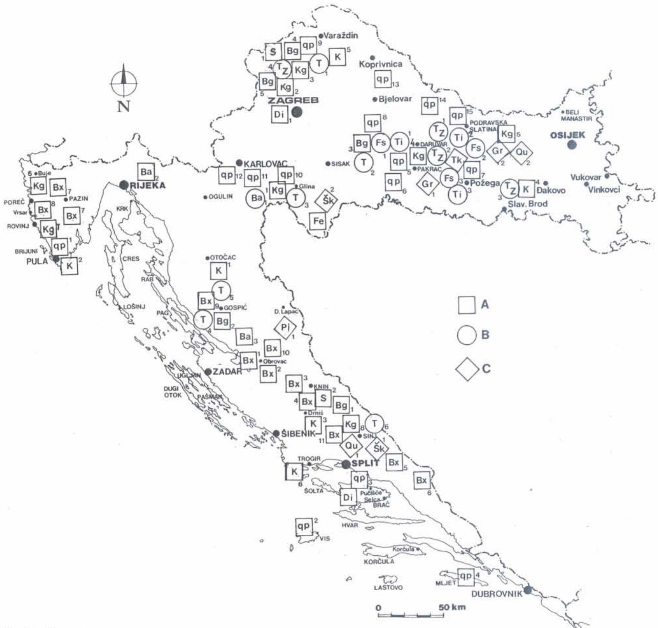
Sl. 3 - Nemetalne mineralne sirovine umjerenog potencijala u Republici Hrvatskoj. Ležišta: A - egzogena, B - endogena, C - metamorfna

Istražena su ležišta barita u Gorskom Kotaru, na Petrovoj gori i u Lici (Jurković, 1959. i 1962).