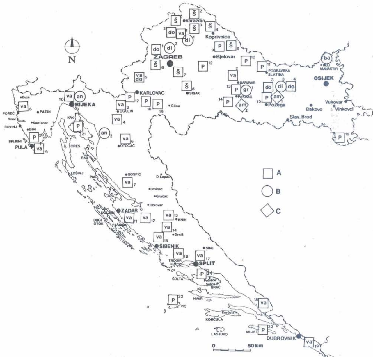
Sl. 2 - Nemetalne mineralne sirovine visokog potencijala u Republici Hrvatskoj. II. dio: Ležišta građevinskih materijala, osim arhitektonskog kamena. Ležišta: A - egzogenena, B - endogenena, C - metamorfna.

Slavonska regija odlikuje se velikom zastupljenošću eruptivnih, metamornih i sedimentnih stijena, ali u njoj nema kamenoloma arhitektonskog kamena zbog jake tektonske poremećenosti naslaga. U prob-