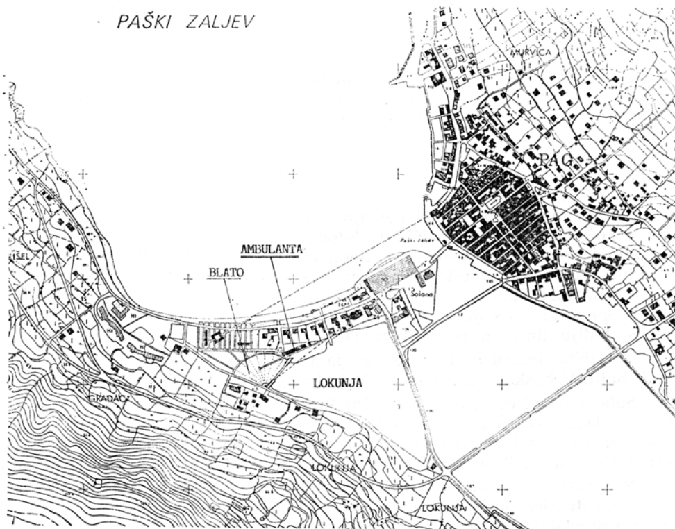
Slika 1. Panorama Paga. Označeno je mjesto predviđeno za izgradnju ambulante za primjenu limana

Uočivši medicinsku važnost nalazišta limana u jezeru Blato na otoku Pagu jedan od autora (Repač 1987) projektirao je ambulantu za njegovu