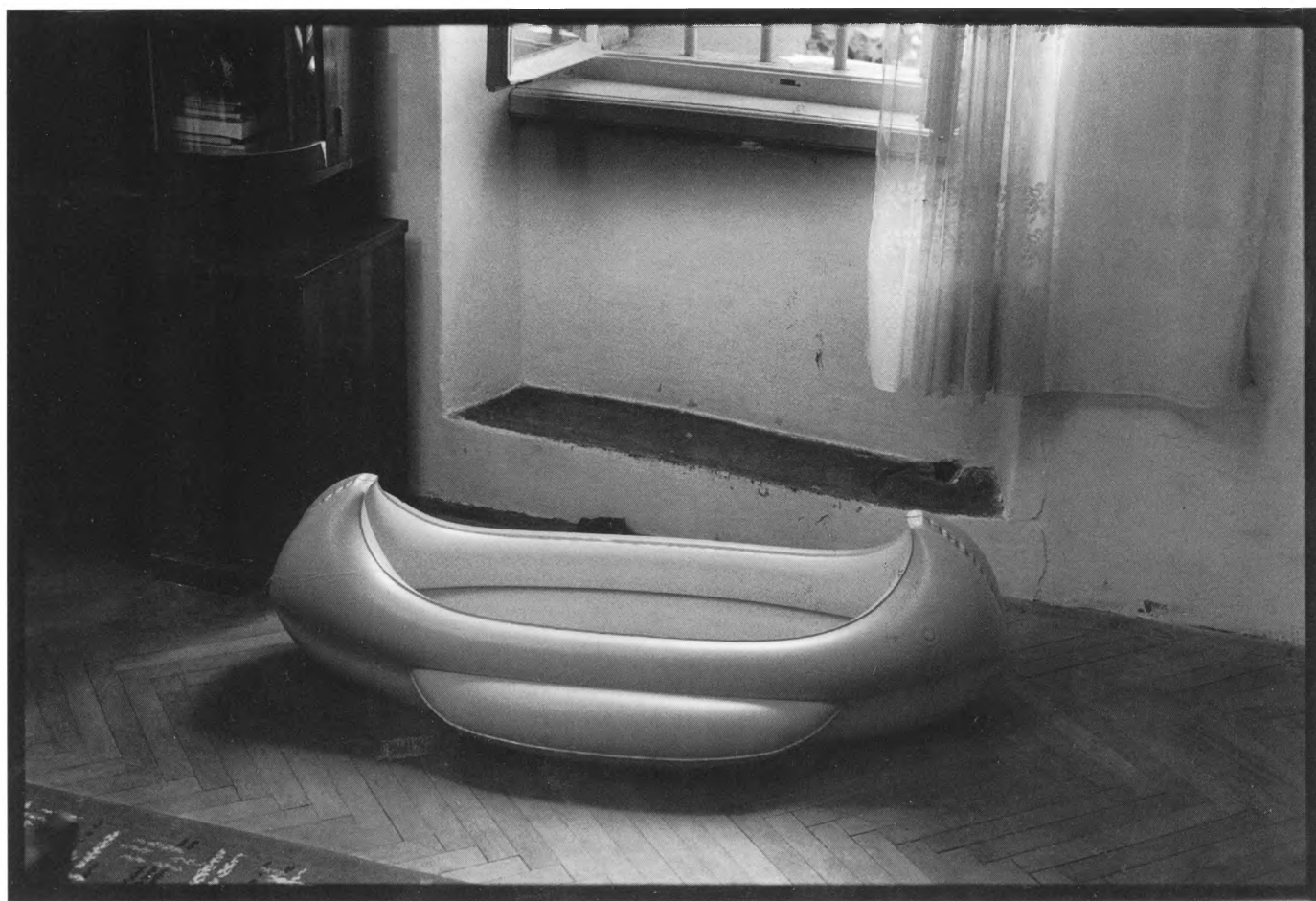
Boris Cvjetanović Nerežišće 1991., iz serije fotografija "Prizori bez značaja"

na kojoj ostaje kratkotrajni trag posljednjeg daha i fotografije, koja bilježi na uglačanoj posrebrnoj metalnoj pločici Daguerra ili memorijskoj kartici digitalnog aparata trenutak kada neponovljivi suptilni dah života ispuštaju ljudi, stvari i priroda. Ono fotografirano poslije pritiska na okidač više nije isto i fotografija ostaje kao dokaz o onom trenutku. Vjerojatno je u vezi fotografije i smrti nešto slično, mislio i Jerman, koji je baveći se fotografijom na način da propituje sam medij koristeći fotografski papir na jednoj od fotografija napisao gotovo tautološki tekst (promatrano u ovom kontekstu) "Krepaj fotografijo!", ostavljajući je nefiksiranu i podložnu propadanju. Ona koja se bavi smrću mora na kraju i sama umrijeti! Danas je spomenuta fotografija u vlasništvu privatnog kolekcionara koji ju je fiksirao i sačuvao od njene smrti. No, zaustavimo li se u ovim makabričkim mislima i pogledamo li veseliju stranu, ustanovit ćemo da i naša, sada već, stošezdeset i jednogodišnjakinja zapravo uopće ne umire, već proživljava razdoblje zadivljujuće metamorfoze. Promijenio se je sasvim sigurno rječnik inicirane elite pa su tako fotografski alkemičari s početka stoljeća koristili riječi kao albumin, kolodij, srebrni nitrat, brenchkatehin, fiksir itd., dok