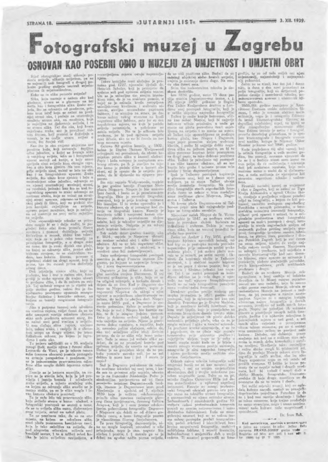
Presnimka članka o osnivanju fotografskog odjela u MUO, "Jutarnji list", 3. 12. 1939.