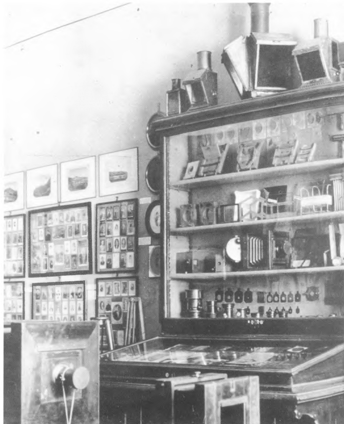
Postav Zbirke fotografija MUO, 1939/40

Fotografska produkcija druge polovice 19. stoljeća najvećim dijelom zasniva se na tzv. dizderijevskom formatu, veličine 6x9 cm, i zastupljena je u fundusu MUO-a s velikim brojem od otprilike 5000 predmeta, pa je bilo logično njihovo objedinjavanje. Unutar podskupina formirani su nacionalni i svjetski katalozi. Svaki katalog obrađen je po autorima s pripadajućom radnom kartotekom u formi abecednoga kazala individualnih ili korporativnih autora, odnosno atelier. Kod fotografskih ostvarenja nastalih u 20. stoljeću grada je klasificirana samo po pravilima autorskoga kataloga. Ad.4. Skupina razglednica je klasificirana na načelu topografskoga kataloga. Formirani su također nacionalni i svjetski katalozi. Unutar jedinoga kataloga razglednice su poredane prema abecednom redu naziva gradova ili mjesta koje prikazuju. Nacionalnim katalogom obuhvaćene su sve razglednice zatečene u zbirci, dok je katalog sa svjetskom tematikom obrađen parcijalno. Razlog ove djelomične obrade proizašao je zbog pomanjkanja metalnih ormara za smještaj razglednica. Prednost je dana nacionalnome materijalu. Za preostale razglednice utvrđena je količina, označene su pripadajućim inventarnim oznakama i smještene u kartonske kutije.