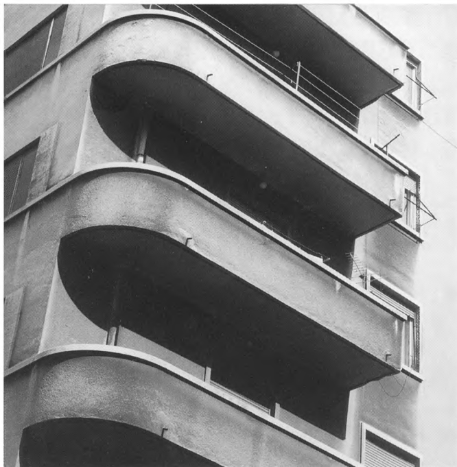
Fotografija koju je Damir Fabijanić snimio za projekt "Urbanizam i arhitektura Rijeke: 1868.–1945. (historicizam-secesija-moderna)" © Damir Fabijanić

Bez obzira na to što još uvijek nije definirana precizna skupljačka koncepcija, plan rasta, razvoja i postava buduće Zbirke fotografija , Stručno vijeće Moderne galerije je 1998. godine izdvojilo najuspjeliji Fabijanićeve fotografije iz dosadašnjih izložaba o riječkoj arhitekturi, prihvativši ih kao inicijalnu akviziciju za buduću, novu Fotografsku zbirku muzejskog fundusa Moderne galerije Rijeka.