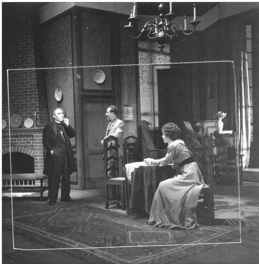
Scenografija za predstavu Stupovi društva , HNK, 1942. godine, Snimio Mladen Grčević, HR HDA 1424/61/15

Fond fotografija filmskog snimatelja Antuna Markića sastoji se od približno 10 000 negativa u raznim formatima i tehnikama koji prikazuju osobe i događaje iz povijesti hrvatske kinematografije u vremenskom razdoblju od 1948. do 1984. godine. Fotografije je popisao i opisao sam autor.