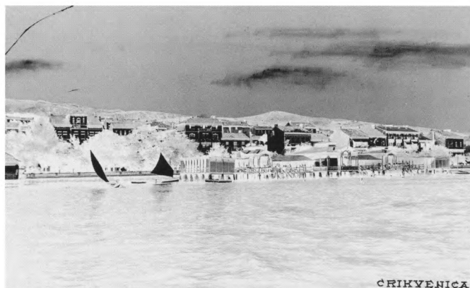
Positiv oštećenog negativa na staklu iz zbirke Griesbach & Knaus, PLC C/81

Zbirka fotografija Gjura Perettija sastoji se od 81 negativa na staklu različitih formata i 22 c/b negativa formata 6x6 cm. Na staklenim negativima su snimke iz života građanske obitelji u Zagrebu (1930.-1945.) koje prikazuju članove obitelji Peretti i stari grad Zagreb, a negativni na filmu sadržavaju snimke staroga kupališta na Savi te šestinske pralje koje su snimljene 40-ih godina.