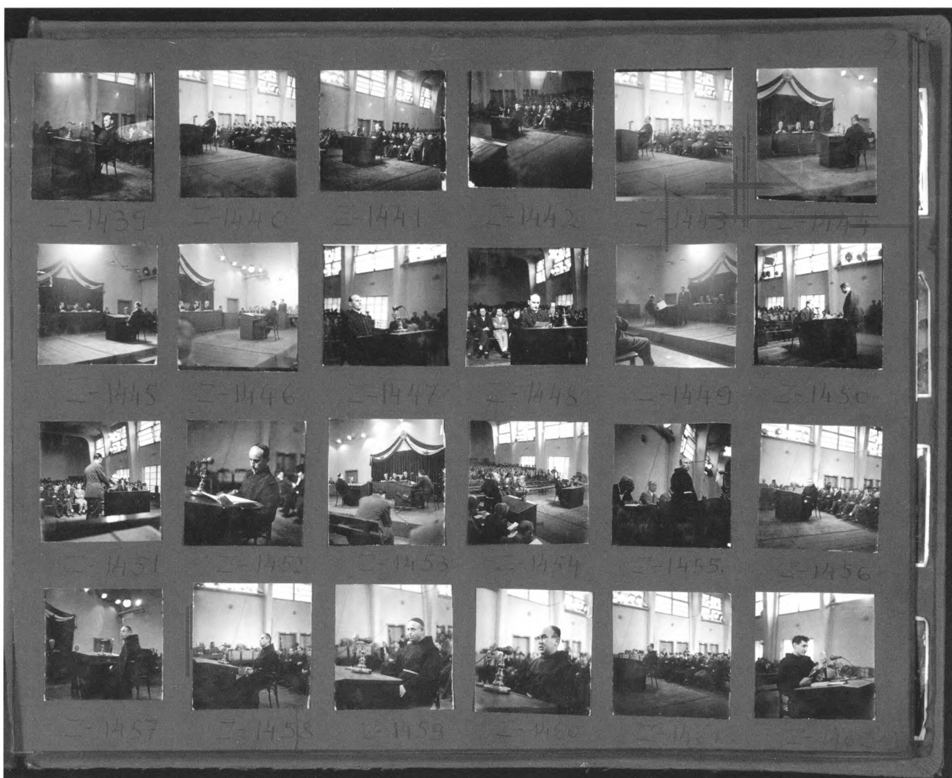
Album kontaktnih kopija negativa snimljenih na suđenju nadbiskupu Alojziju Stepincu HR HDA 1422/Z1439-Z1462

Unosom 5000 fotografija s odgovarajućim opisom stvorena je brzo pretraživa baza koja omogućava korisniku da u najkraćem roku dođe do željenog imena ili događaja s podacima o fotografu, mjestu snimanja, tehnici i veličini fotografije te inventarnom broju i topografskoj oznaci. Prigodom unosa u bazu fotografije se skeniraju relativno malom rezolucijom od 100 DPI kako se baza ne bi preopteretila i time izgubila na brzini povrata informacije. Ova rezolucija dostatna je za očitavanje slike na monitoru te ispis u formatu 1:1.