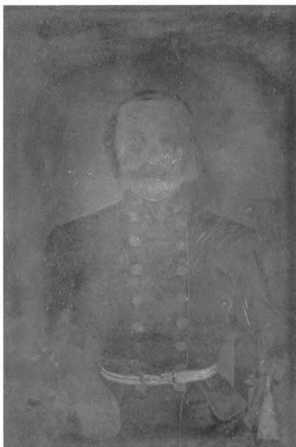
Dagerotipija nepoznatog časnika, iz fonda Razne obitelji (br. 786) kut. br. 4, obitelj Crnković, 8x10,5 cm

Fotografije se na taj način odvajaju od štetnog okruženja (papiri visoke kiselosti, ljepila, metalne spojnice itd.) te postaju prikladne za adekvatnu arhivističku obradu kojom se povećava njihova dostupnost, što i jest jedna od temeljnih zadaća arhiva. Svako odvajanje iz cjeline bilo da se radi o fondu ili zbirci zahtijeva ostavljanje pismenog traga o prethodnom