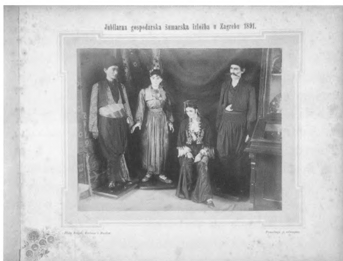
Iz albuma Jubilarna gospodarska šumarska izložba 1891. , Snimio Hinko Krapek, HR HDA 1435

Zbirka fotografija Instituta za migracije i narodnost sastoji se od približno 10.000 fotografija različitih formata, a prikupljane su iz različitih izvora. Dio fotografija prikupljen je za veliku izložbu o iseljenicima koja je održana u Zagrebu 1938. godine, dio je priključen zbirci prestankom rada